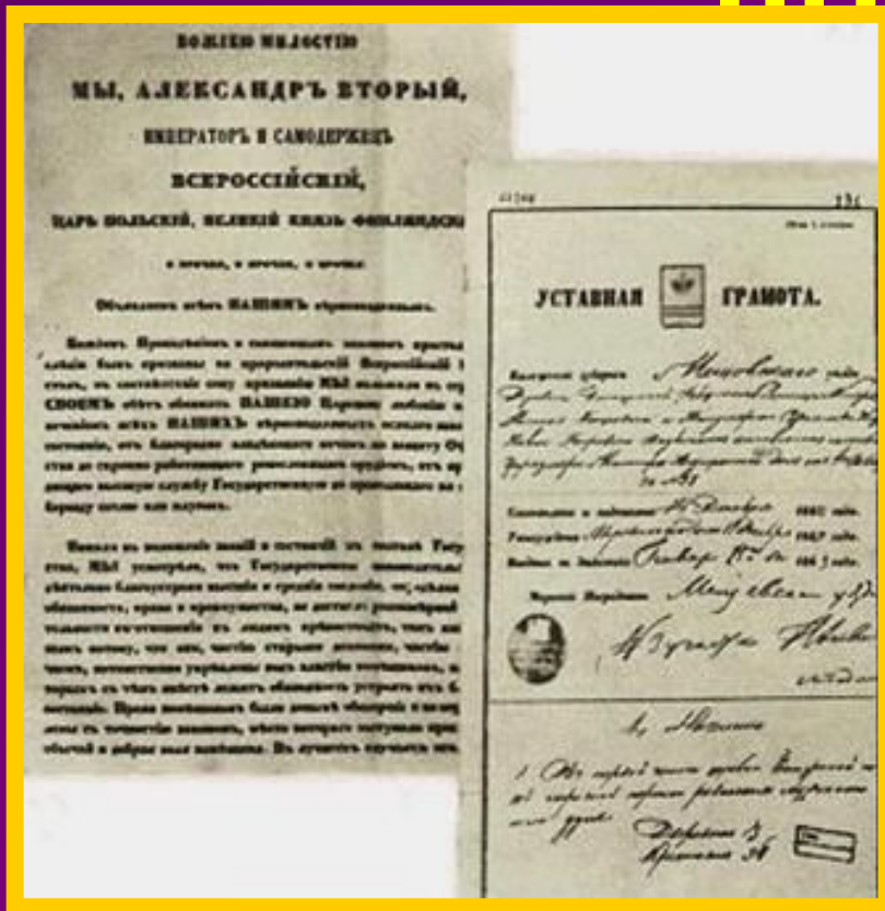
Документы «Великой реформы».