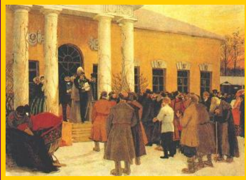
Б.Кустодиев. Освобождение крестьян.