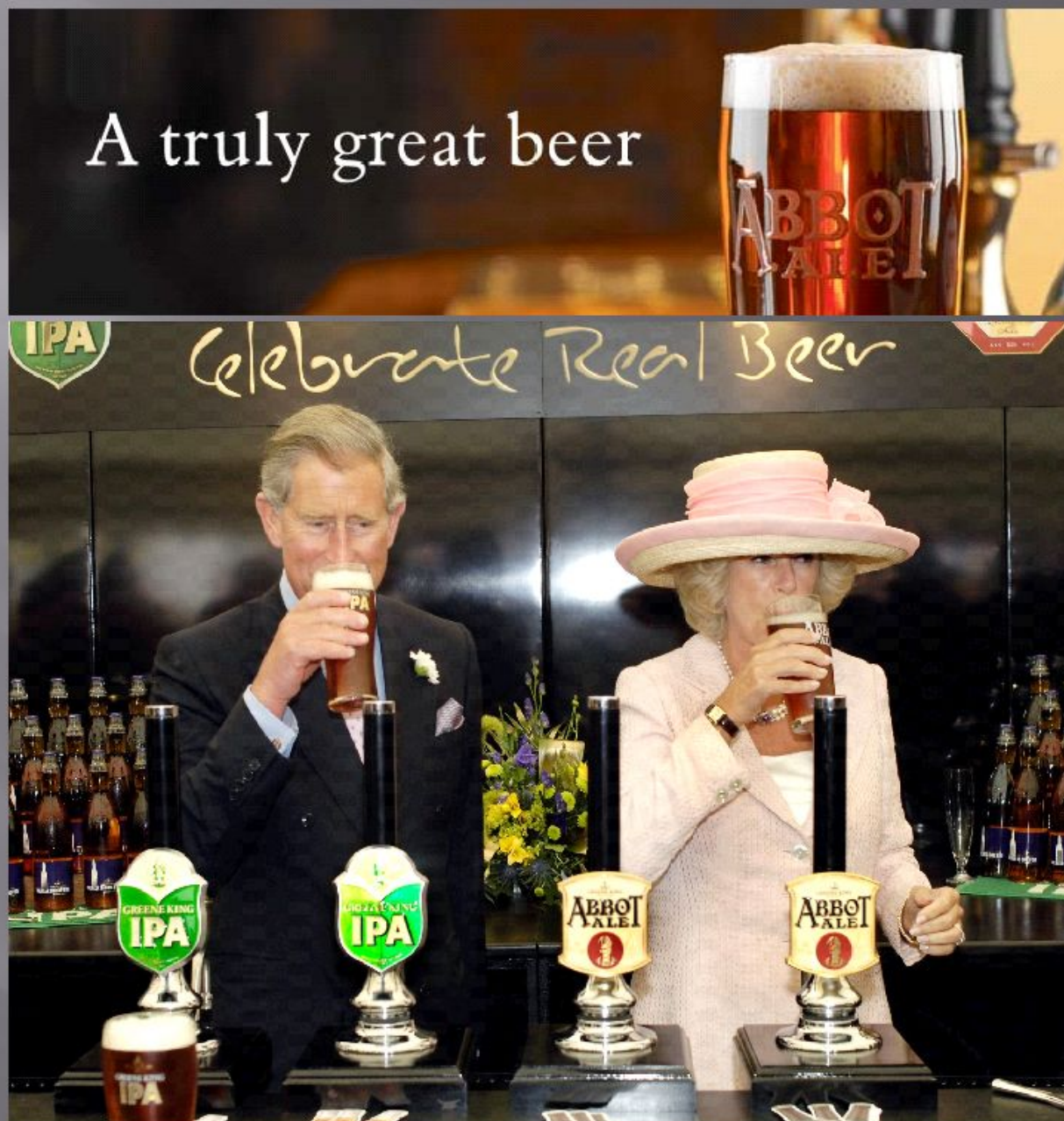
Принц Чарльз и Камилла Паркер Боулз