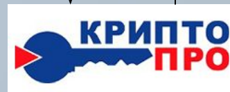
Программа криптографической защиты