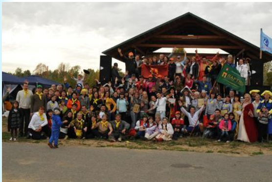
Городской фестиваль риэлторов