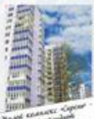
Жилые комплексы «Сервис» – удобный стандарт комфортной жизни

Каждый человек вкладывает в слово «дом» свой смысл. Для одного человека это место работы, для другого – уютный семейный очаг, для третьего дом – это место, где счастлива вся его семья.