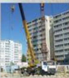
Здание жилого комплекса «Кировец» в процессе строительства

«МЖК «Кировец»» строит современные жилые комплексы. Мы строим дома, которые становятся частью жизни. Мы строим дома, которые становятся частью жизни. Мы строим дома, которые становятся частью жизни.