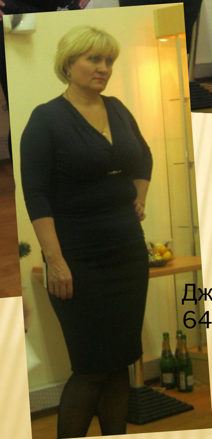
Джемпер арт. 645