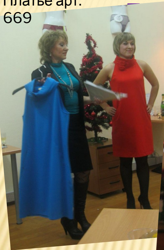
Платье арт. 669