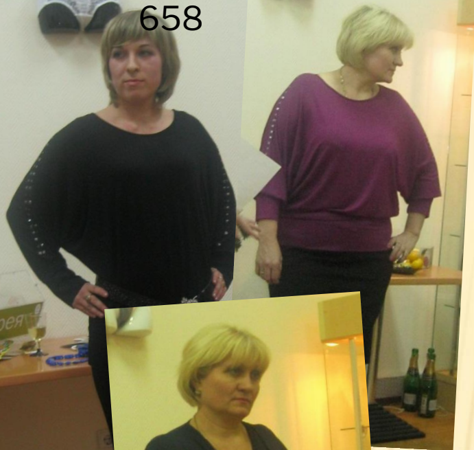
Джемпер арт. 658