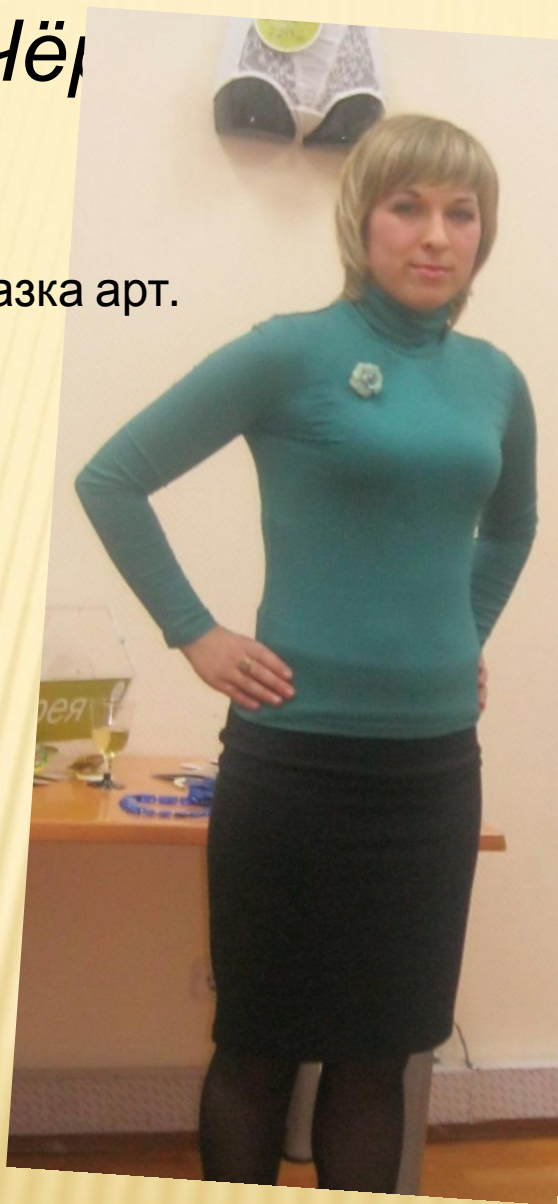
Водолазка арт. 204