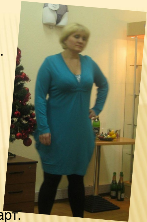
Легинсы арт. 583