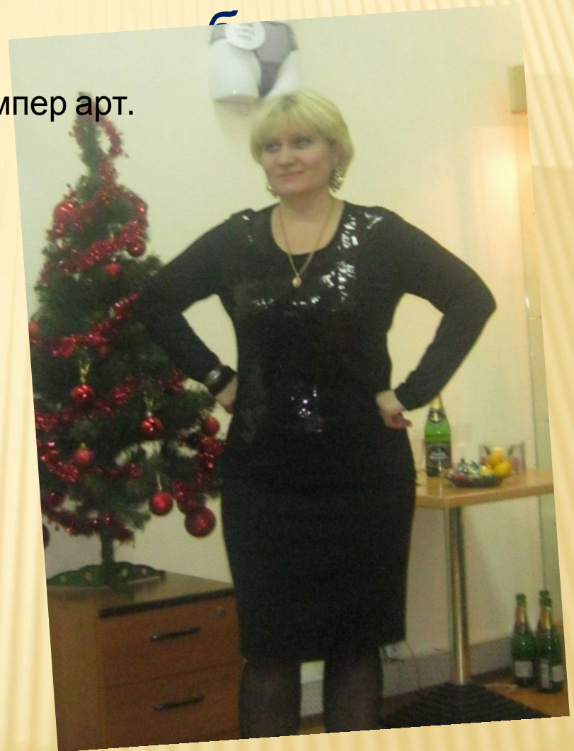
Джемпер арт. 659