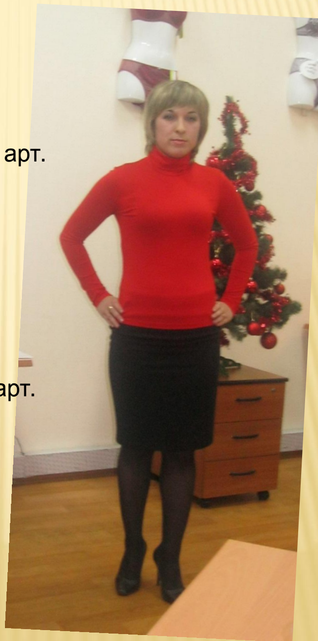
Юбка арт. 547