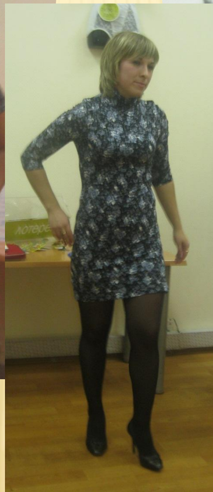
Платье арт. 661