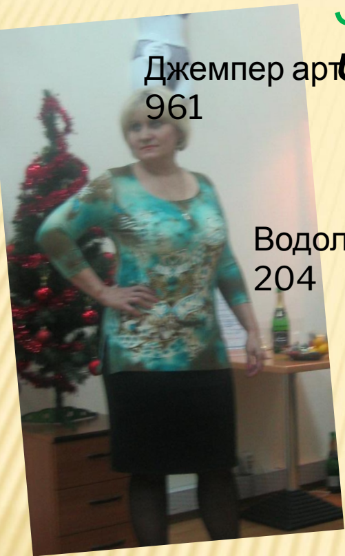
Водолазка арт. 204