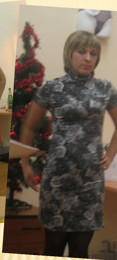
Платье арт. 682