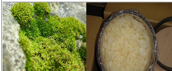
ДУБОВЫЙ МОХ, ФИАЛКА, БЕЛЫЙ МУСКУС