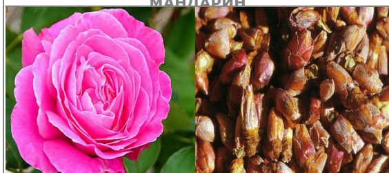
АБСОЛЮ МАРОККАНСКОЙ РОЗЫ. ЦВЕТЫ СМОРОДИНЫ, ИРИС