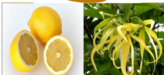
БЕРГАМОТ, ИТАЛЬЯНСКИЙ ЛИМОН, ИЛАНГ, СЛИВА, ГРЕПФРУТ