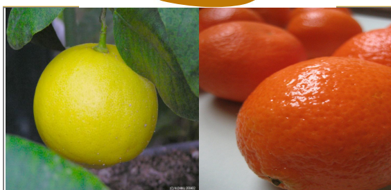
БЕРГАМОТ, ПОМЕРАНЕЦ, ЛИМОН, МАНДАРИН