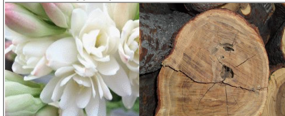
ТУБЕРОЗА, БЕЛЫЙ МУСКУС, ФИАЛКА, ИНДОНЕЗИЙСКОЕ САНДАЛОВОЕ ДЕРЕВО