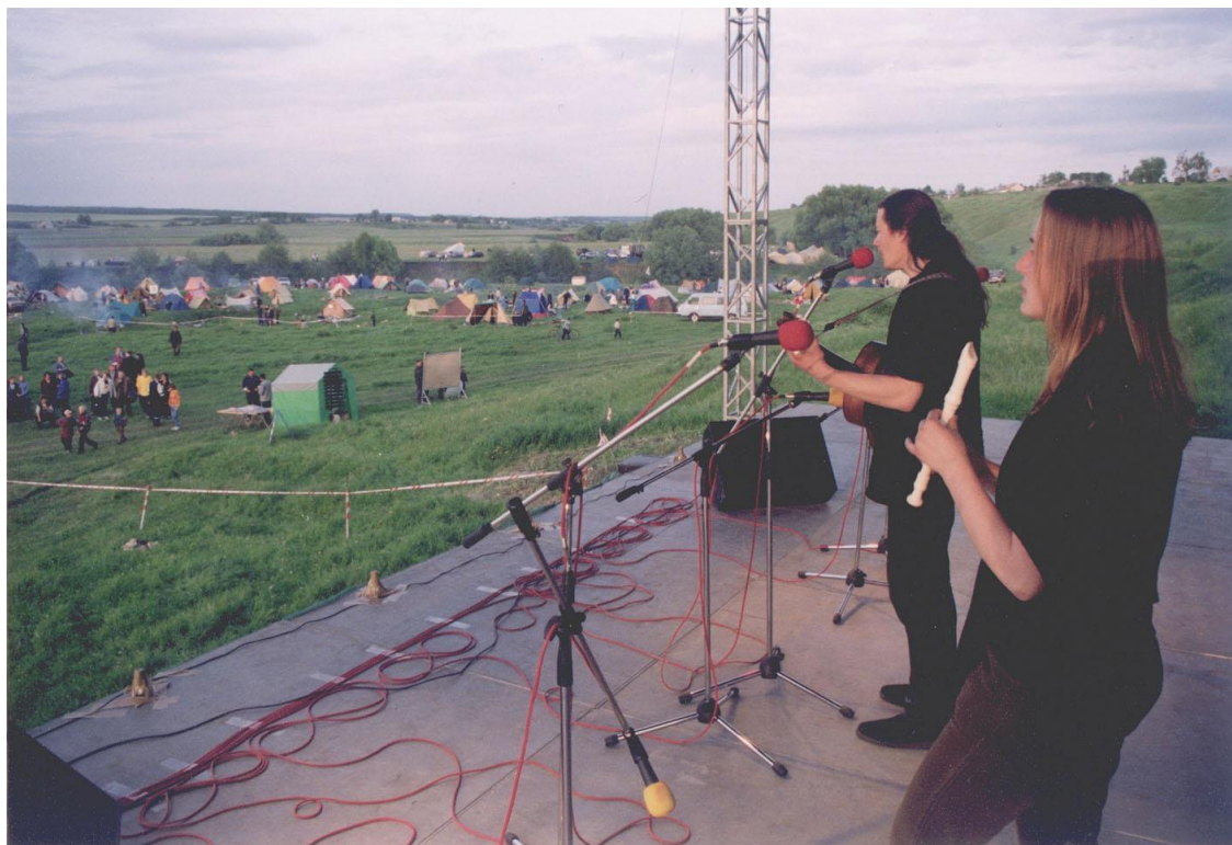
Фестиваль авторской песни. Последние выходные мая (с. Монастырщино, Кимовский р-н Тульской области)