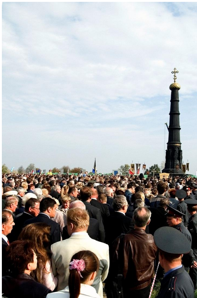
День воинской славы России – Празднование годовщины Куликовской битвы Третья суббота сентября, 21 сентября (с. Монастырщино Кимовский р-н, д. Ивановка, Куркинский р-н Тульской области)