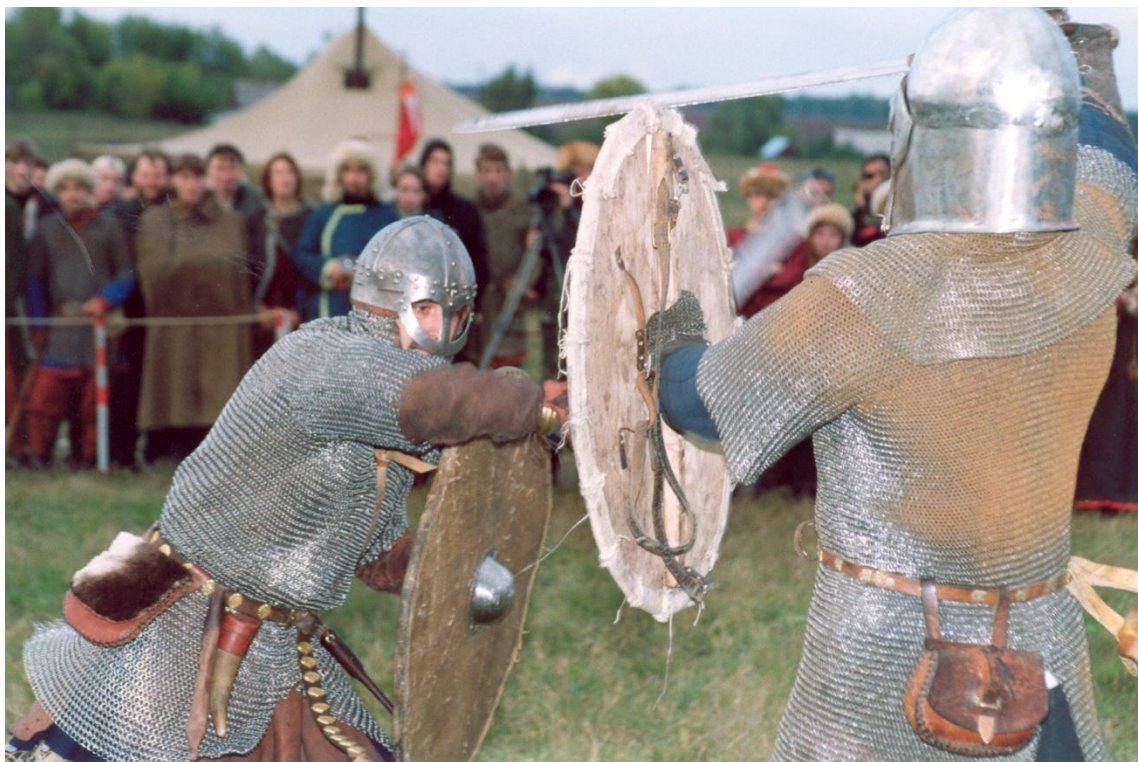
Международный военно-исторический Фестиваль «Поле Куликово» Сер. сентября (д. Татинки, Кимовский р-н Тульской области)