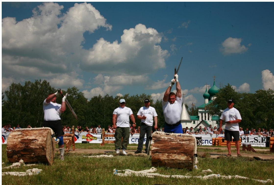
День России на Куликовом поле. 12 июня (с. Монастырщино, Кимовский р-н, д. Ивановка, Куркинский р-н Тульской области)