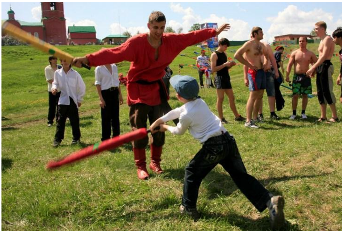
Фестиваль народных традиций «Былина» Третья суббота мая. (с. Монастырщино, Кимовский р-н Тульской области)