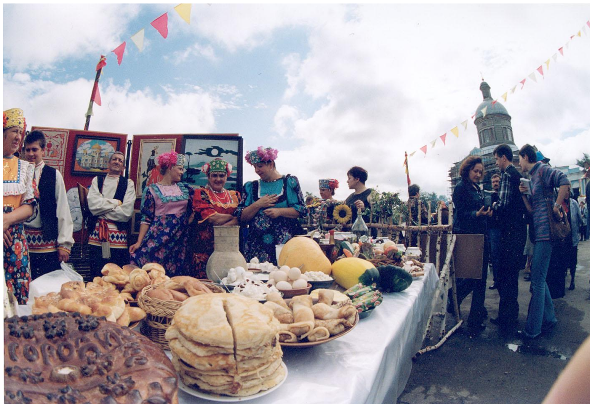
Межрегиональный фестиваль «Епифанская ярмарка». Сер. Августа, накануне медового спаса (п. Епифань Кимовский р-н Тульской области).