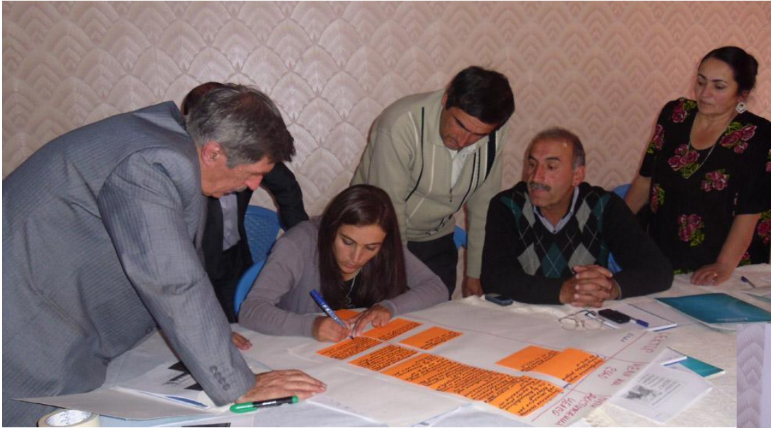
Семинар по ПСУ в Хороге: 8 октября, 2011 г.