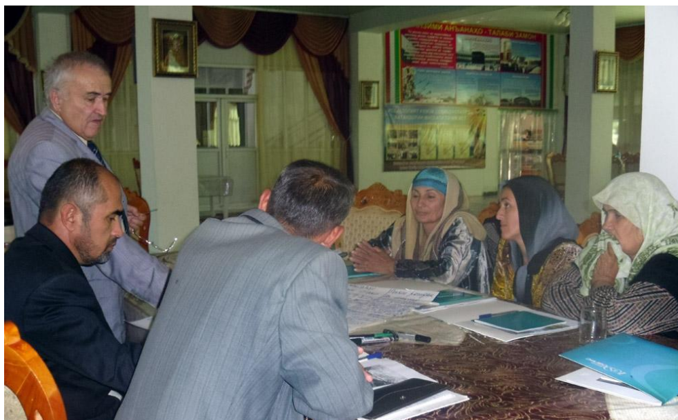
Семинар по ПСУ в Курган-Тюбе: 14 октября, 2011 г.