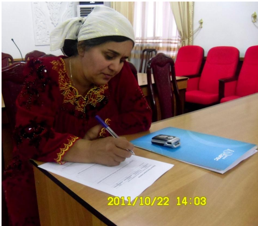
Семинар по ПСУ в Вахдате: 22 октября, 2011 г.