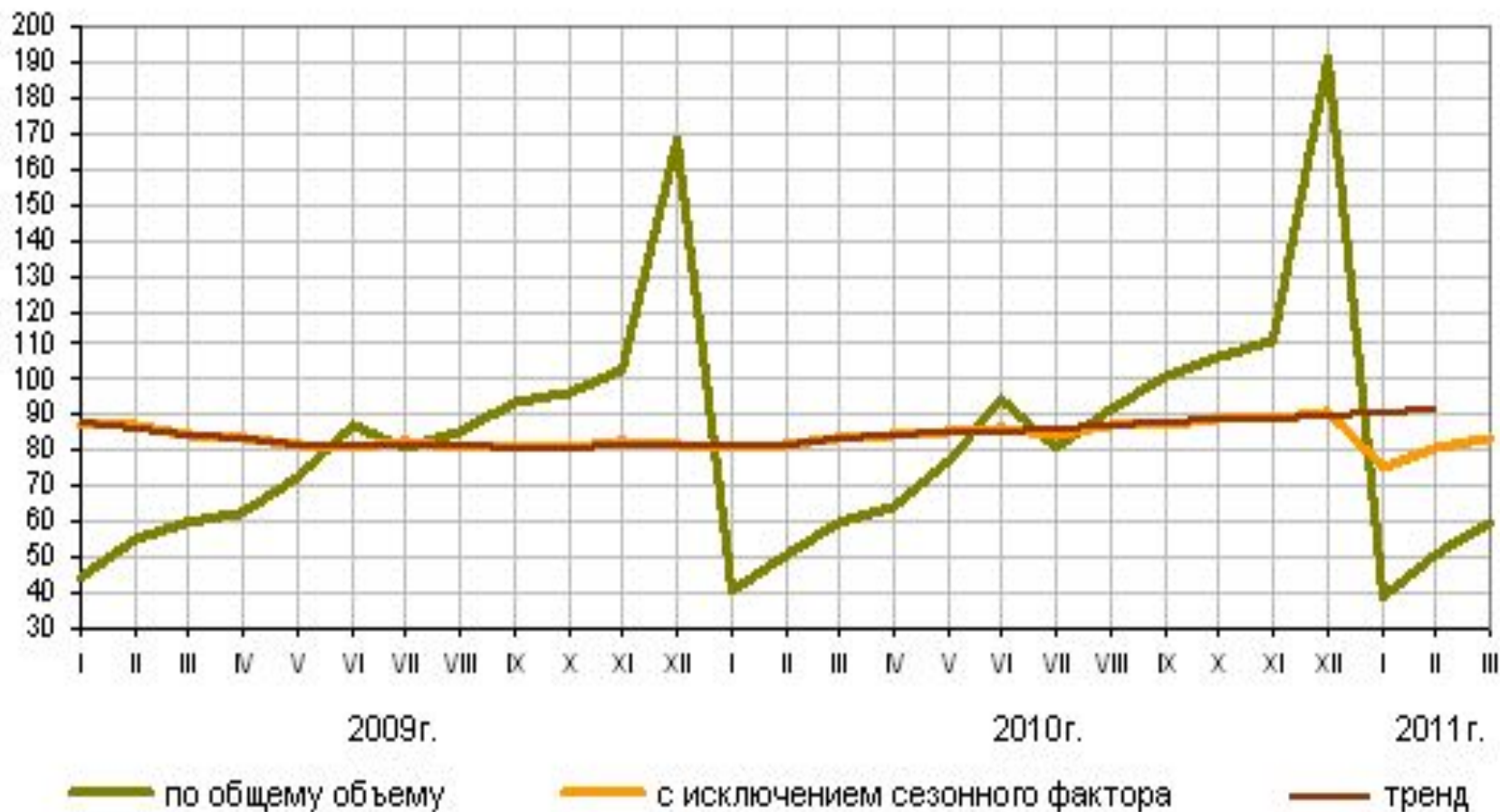
Динамика инвестиций в основной капитал в % к среднемесячному значению 2008г.