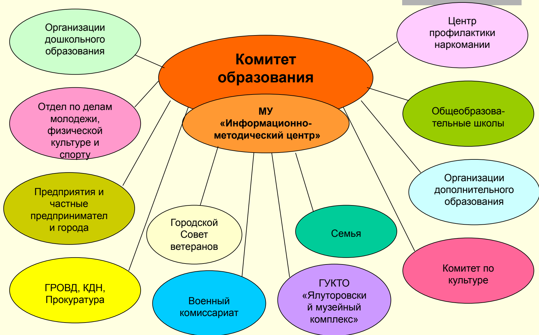
Схема взаимодействия образовательных учреждений с городским сообществом по вопросам гражданского и патриотического воспитания детей и подростков