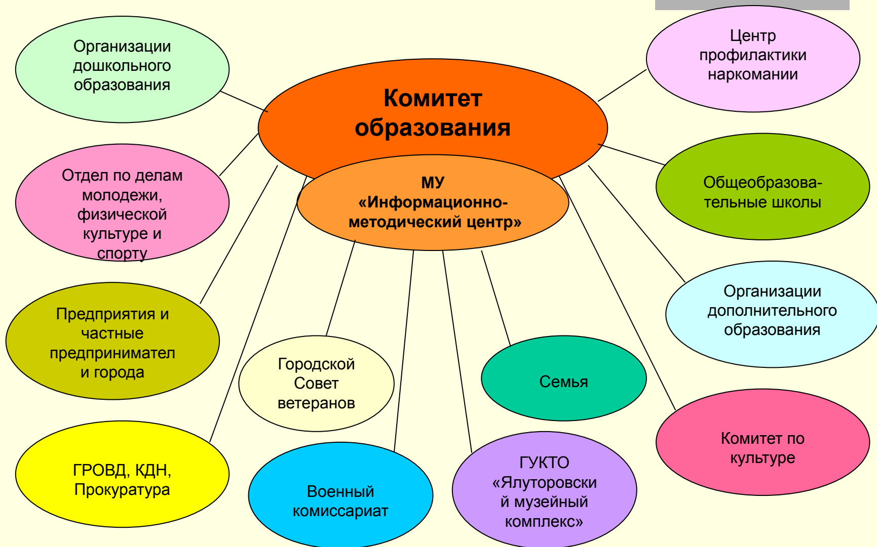
Схема взаимодействия образовательных учреждений с городским сообществом по вопросам гражданского и патриотического воспитания детей и подростков