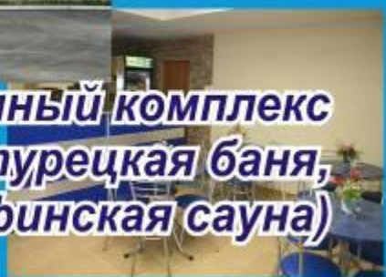
Банный комплекс (турецкая баня, финская сауна)