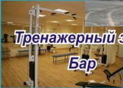
Тренажерный зал Бар