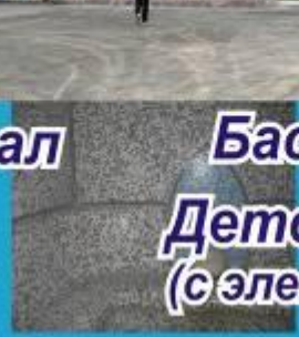
Бассейн 25 м Детский бассейн (с элементами аквапарка)