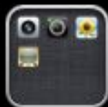
Фото и видео