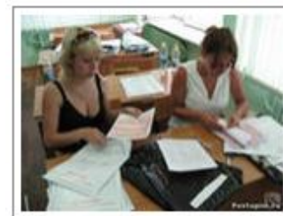
Региональный центр обработки информации работает круглосуточно