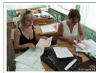
Региональный центр обработки информации работает круглосуточно