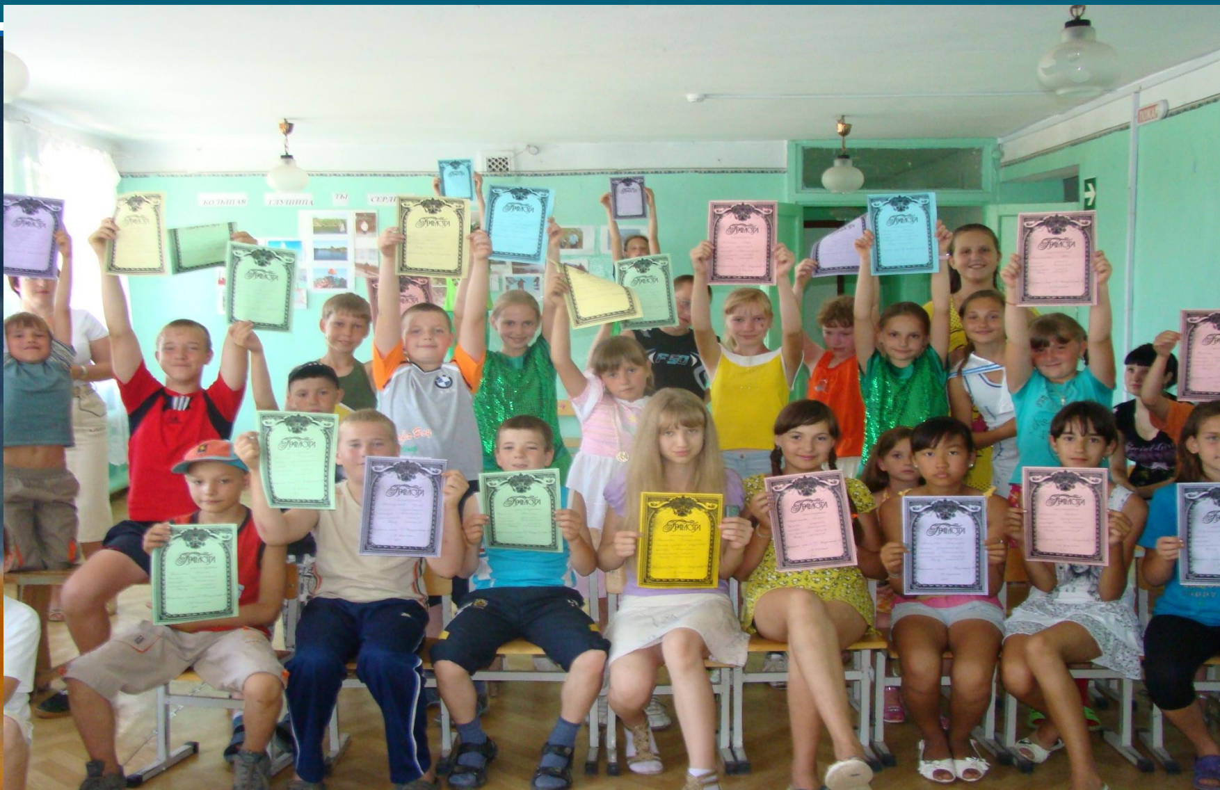
«День успеха» в лагере дневного пребывания «Город мастеров»