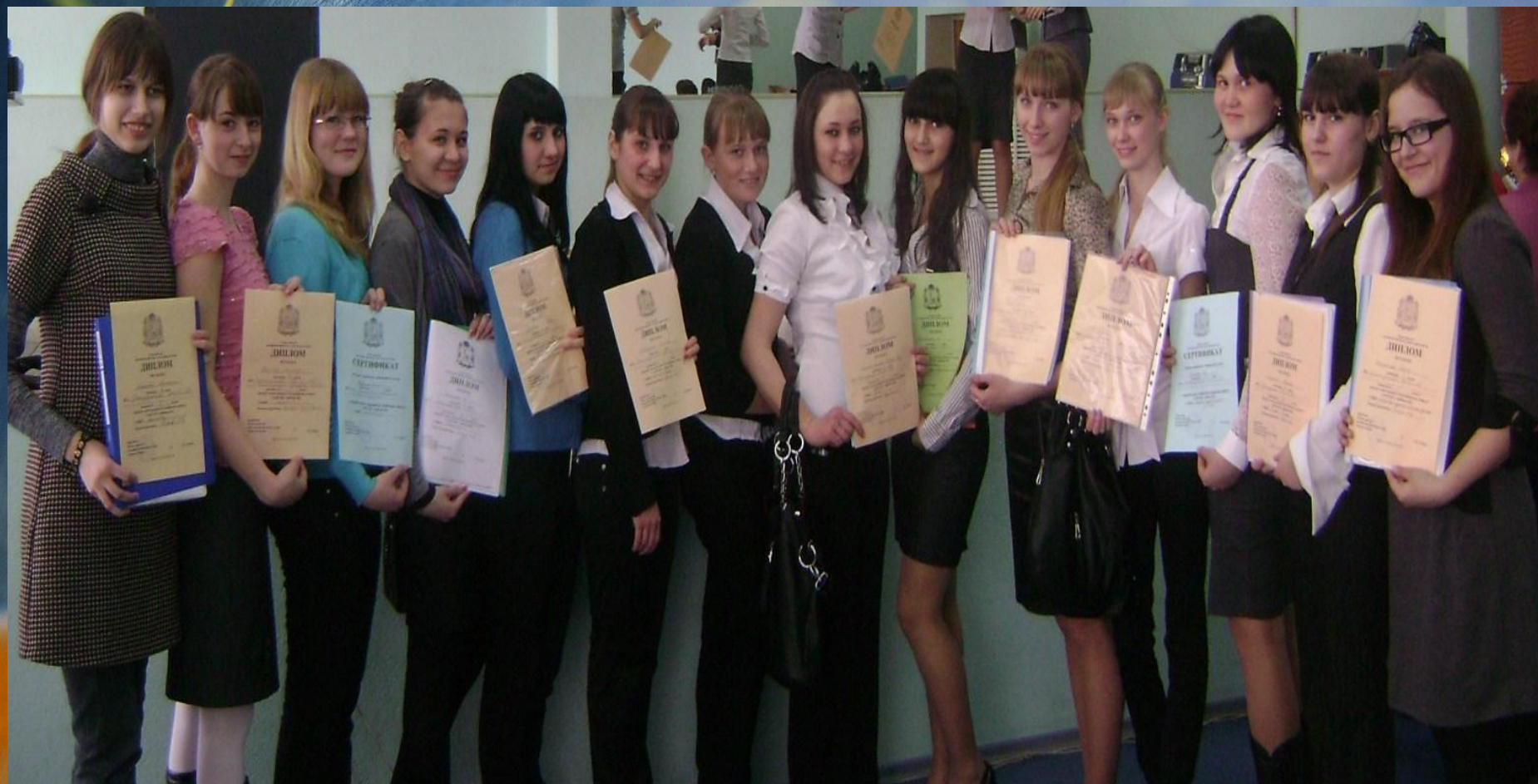
Победители Окружной научно-практической конференции 2011