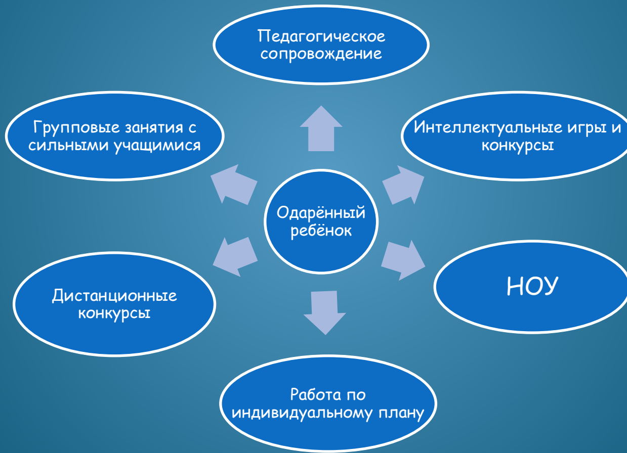
Схема системы работы с одарёнными детьми