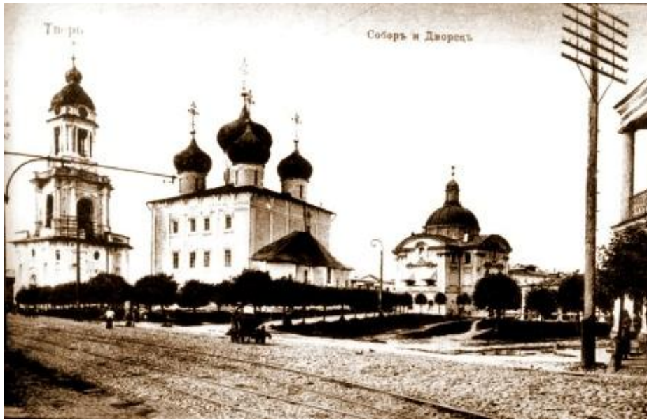
Спасо-Преображенский собор г. Тверь

В 1285 году, в 14-летнем возрасте, Михаил становится тверским князем.