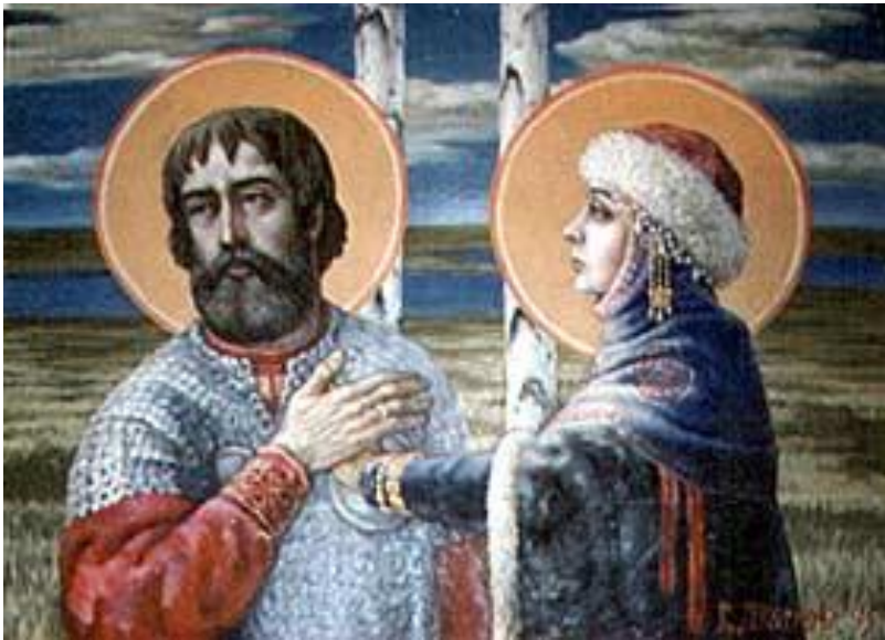
Святая Анна Кашинская провожает святого Михаила Тверского на смерть в Орду

Юрий Данилович поехал в Орду и начал жаловаться на Михаила Ярославича, обвиняя его даже в отравлении своей жены — сестры хана, которая умерла в Твери, находясь в плену. Михаила Ярославича потребовали в Орду. Ехать при таких обвинениях— значило ехать на верную смерть.