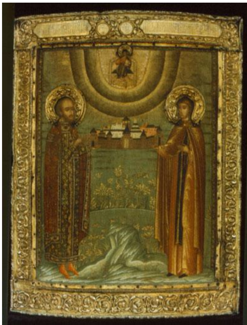
Святой князь Михаил Ярославич Тверской и княгиня Ксения Тверская, 17 век