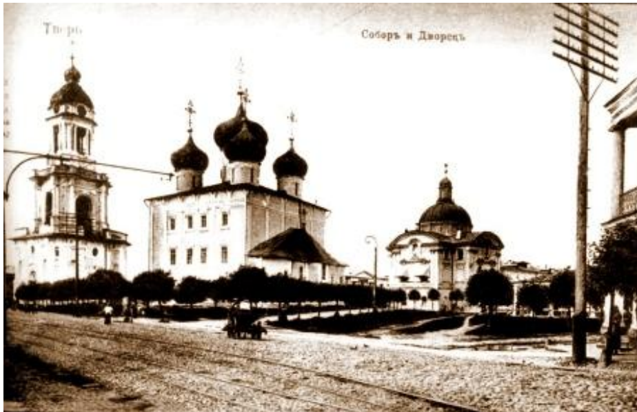
Спасо-Преображенский собор г. Тверь

В 1285 году, в 14-летнем возрасте, Михаил становится тверским князем.