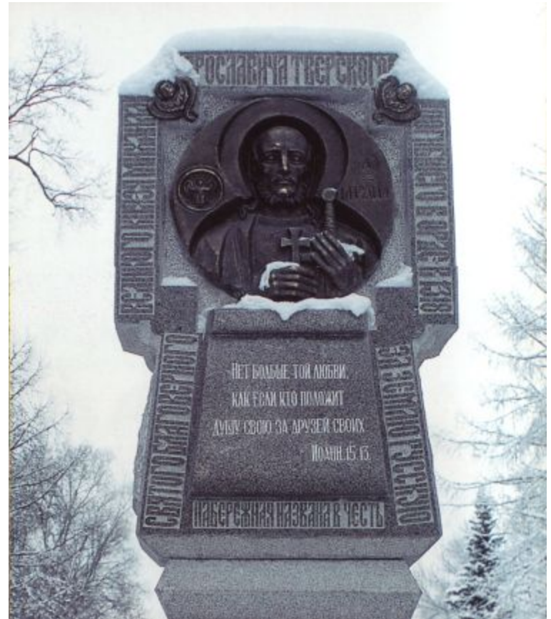
Поклонный крест Михаилу Тверскому. Скульптор Е. Антонов. Тверь, Городской сад