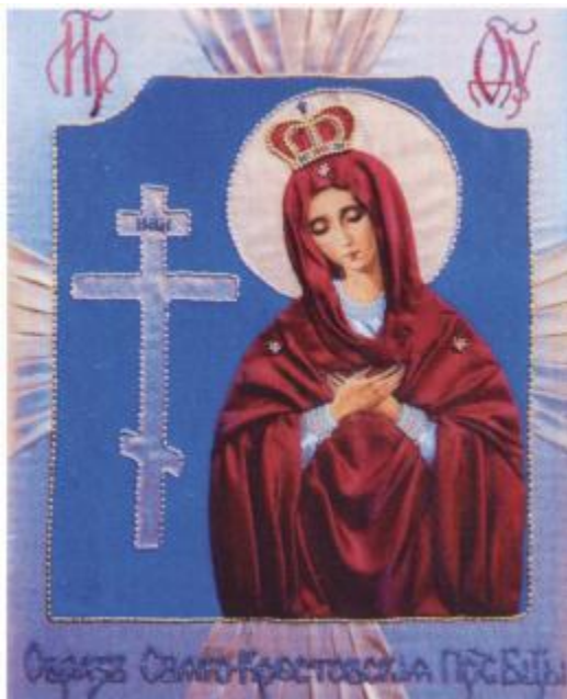
Свято-Крестовская икона Божией Матери, Буденновск, храм Казанской Божией Матери

стали городами-побратимами 5 декабря 2002 года