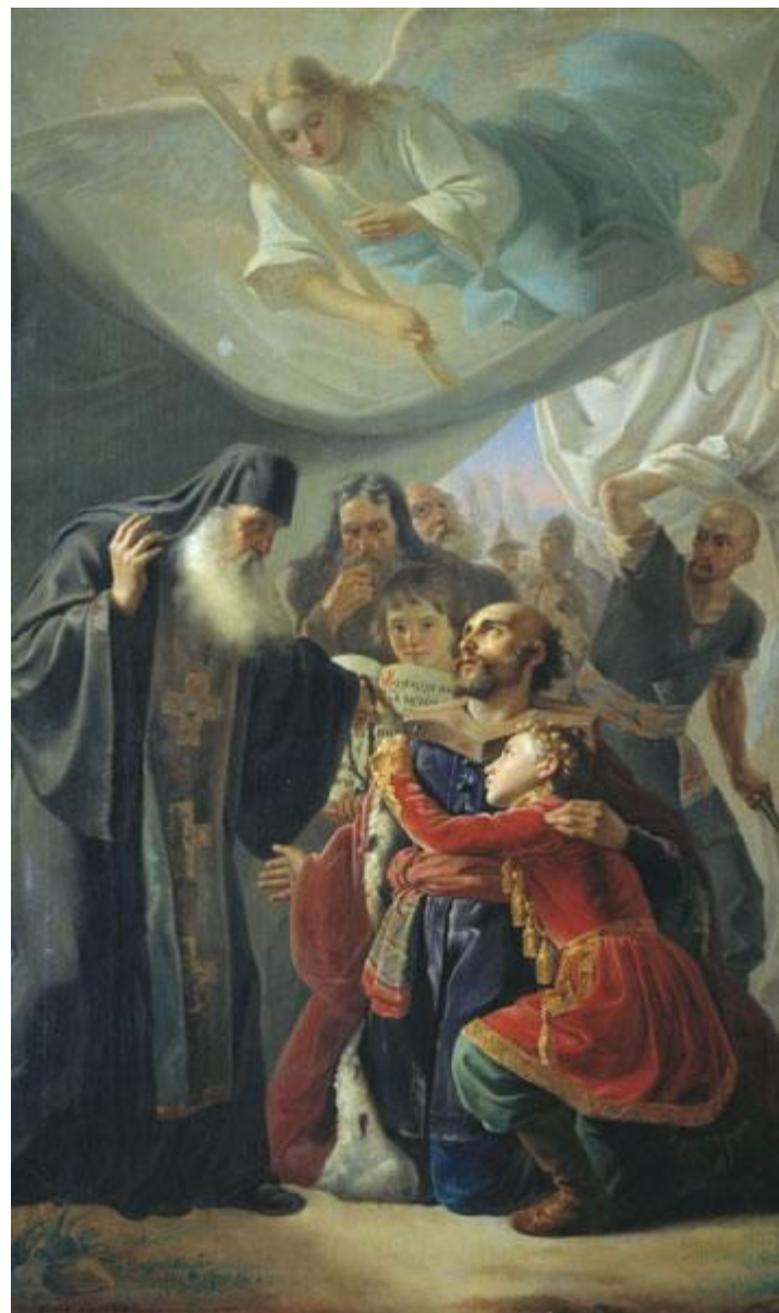
Напутствие великого князя Михаила Тверского 1847г. Автор: Пимен Никитич Орлов

Когда князь-мученик находился за рекой Тереком, близ города Тетякова, предчувствие близкой кончины стало томить его, и он решился при помощи псалтыря предугадать судьбу свою. Псалтырь разогнулся на словах: «Сердце мое смятеся во мне, и страх смерти нападе на мя». «Растолкуйте, что значат эти слова»,— обратился он к бывшим при нем священникам. «Вполне понятны, господин, следующие за сим слова псалма,— отвечали те, уклоняясь от прямого ответа,— возверзи на Господа печаль и той ты препитает и не даст во век молвы праведнику».