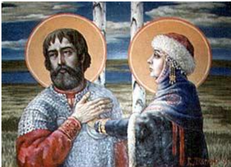
Святая Анна Кашинская провожает святого Михаила Тверского на смерть в Орду

Юрий Данилович поехал в Орду и начал жаловаться на Михаила Ярославича, обвиняя его даже в отравлении своей жены — сестры хана, которая умерла в Твери, находясь в плену. Михаила Ярославича потребовали в Орду. Ехать при таких обвинениях— значило ехать на верную смерть.