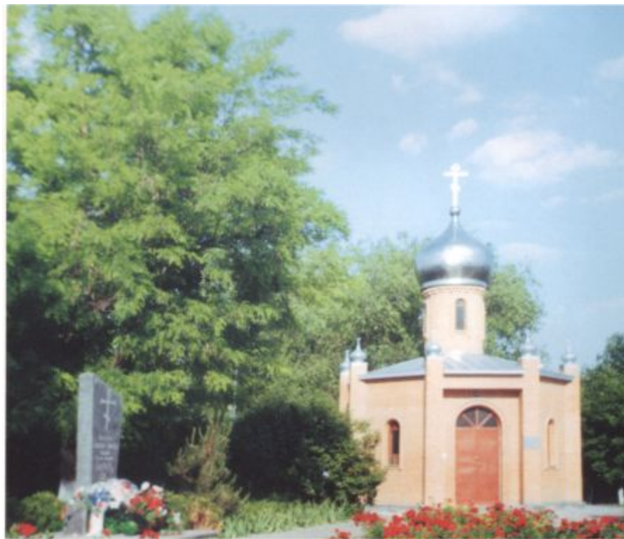
Буденновск, территория больницы, часовня Михаила Архангела и Памятный камень в память всех погибших