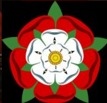
Елизавета Йоркская и Генрих VII

Война закончилась после того, как почти все знатные дворяне истребили друг друга. В борьбу за престол вступил дальний родственник Ланкастеров Генрих Тюдор . Победив в последнем сражении, Генрих женился на дочери короля из династии Йорков и соединил в своем гербе алую и белую розы. С него в Англии началось правление династии Тюдоров.