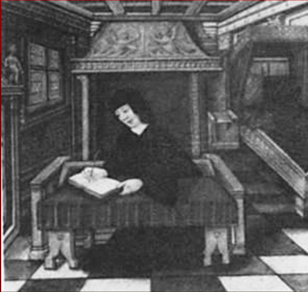
Людовик XI за письменным столом

Людовик XI был полной противоположностью Карлу. В борьбе со своими противниками он использовал любые средства: обман, вероломство, ложь. Хитрый и скупой, король не жалел денег для подкупа сильных врагов, стремился поссорить их. Он льстил людям, которых ненавидел или боялся. Король любил говорить: «Кто не умеет притворяться, тот не умеет царствовать».