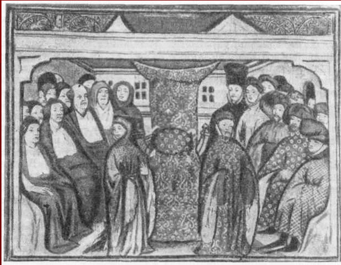
Заседание английского парламента.

При Генрихе VII продолжал собираться парламент. После гибели большинства крупных феодалов король ввел в палату лордов людей, которые пользовались его доверием. Рыцари и горожане, заседавшие в палате общин, беспрекословно утверждали законы, предложенные королем, разрешали ему сбор новых налогов. Власть короля приближалась к абсолютной.