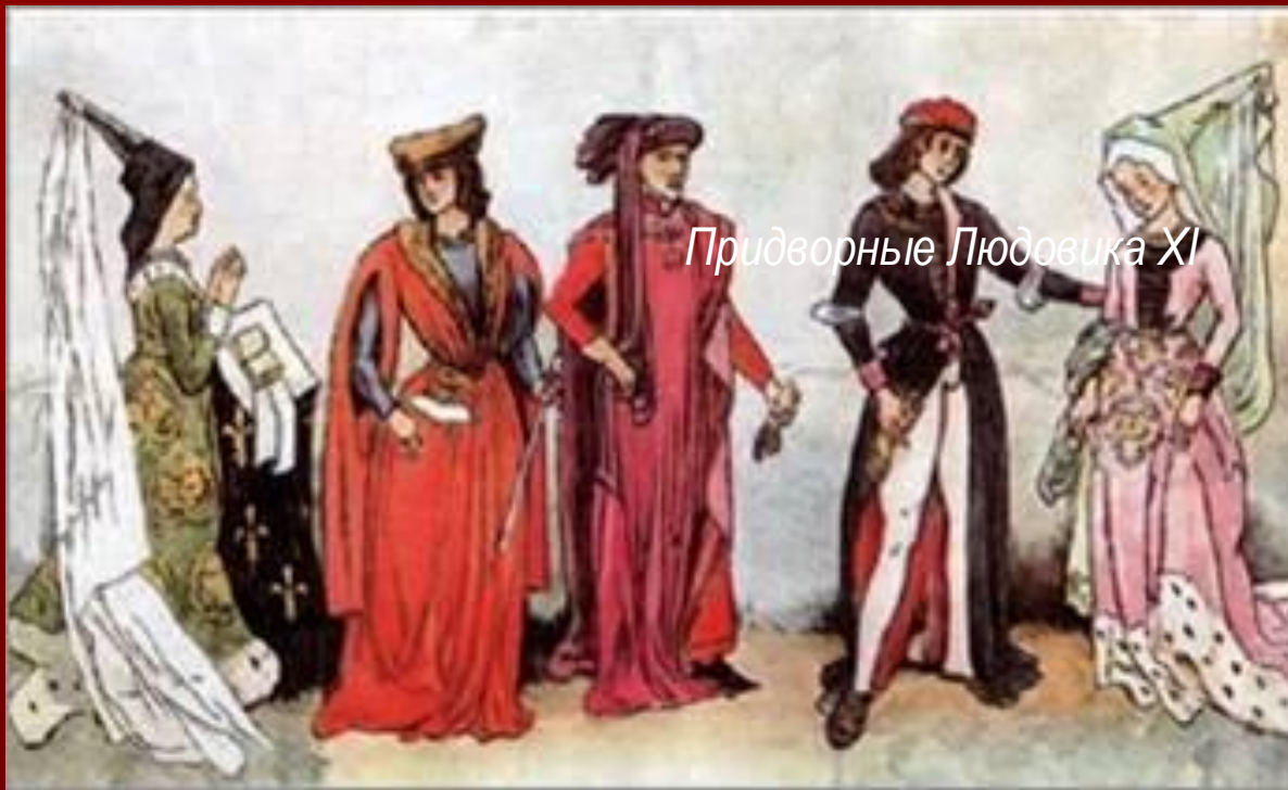
Придворные Людовика XI