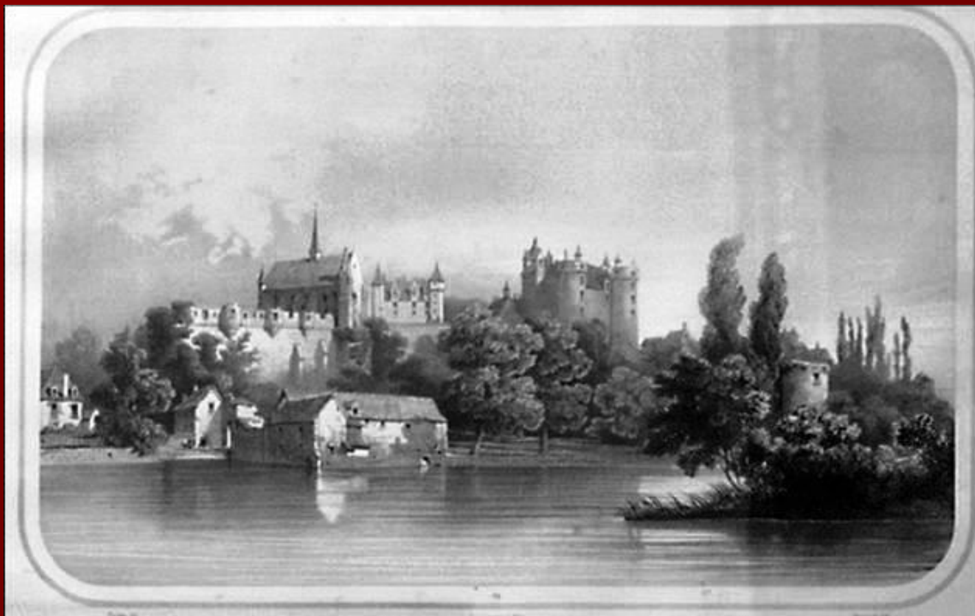
Укрепленный замок Людовика XI

Большая часть герцогства Бургундского досталась королю. К Франции была присоединена и южная область Прованс с городом Марселем . Лишь герцогство Бретань вошло в состав королевских владений при преемниках Людовика XI. К концу XV века объединение Франции завершилось.