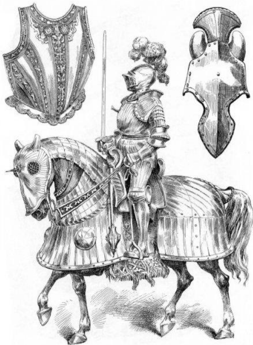
Italian, English and German (16th-century).

С течением времени рыцари полностью оделись в металлическую броню: голову защищал шлем с решетчатым забралом, на руках были кольчужные перчатки, на ногах — чулки из металлических колец. Подобная экипировка требовала недюжинной физической силы и выносливости. Ведь во время боя требовалось не только таскать на себе тяжелые доспехи, но и сражаться с противником. Рыцарь обязан был владеть навыками и конного боя, и пешей схватки.