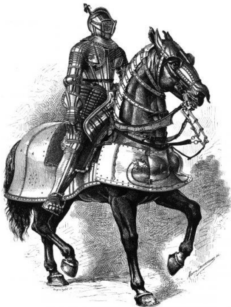
German (17th century).