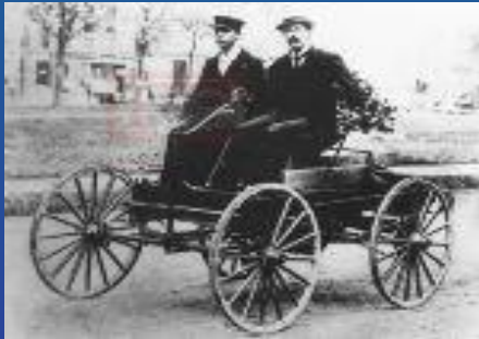
Первый автомобиль, сделанный в Детройте. 1896 год

Первые самобеглые коляски появились в 18 веке в разных странах мира. В течении длительного времени они видоизменялись и совершенствовались. Но, как всякий механизм, они требовали ухода и ремонта в случае поломки. Этим могли заниматься только люди, которые хорошо разбирались во внутреннем устройстве автомобиля. Так появилась новая профессия-автомеханик.