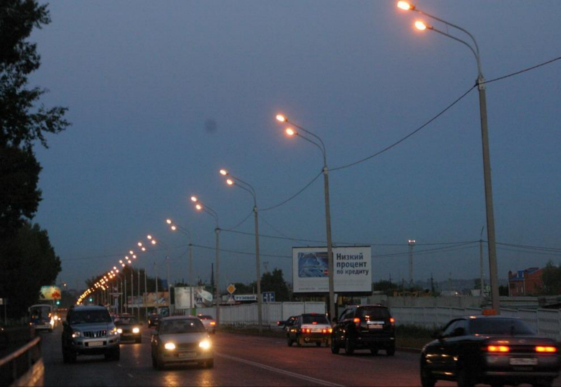
Уличное освещение Павловского тракта