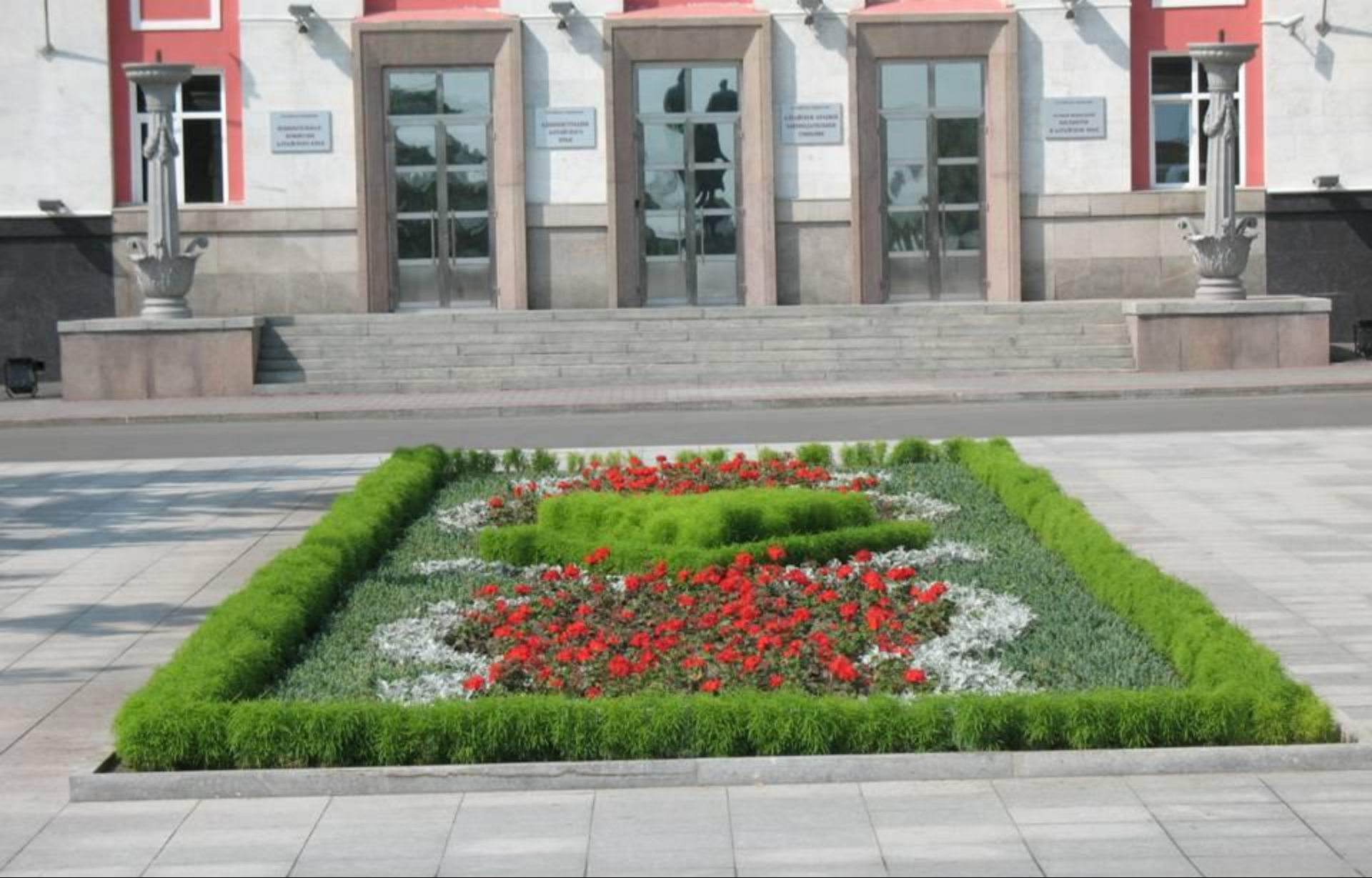
Клумба перед зданием Администрации Алтайского края