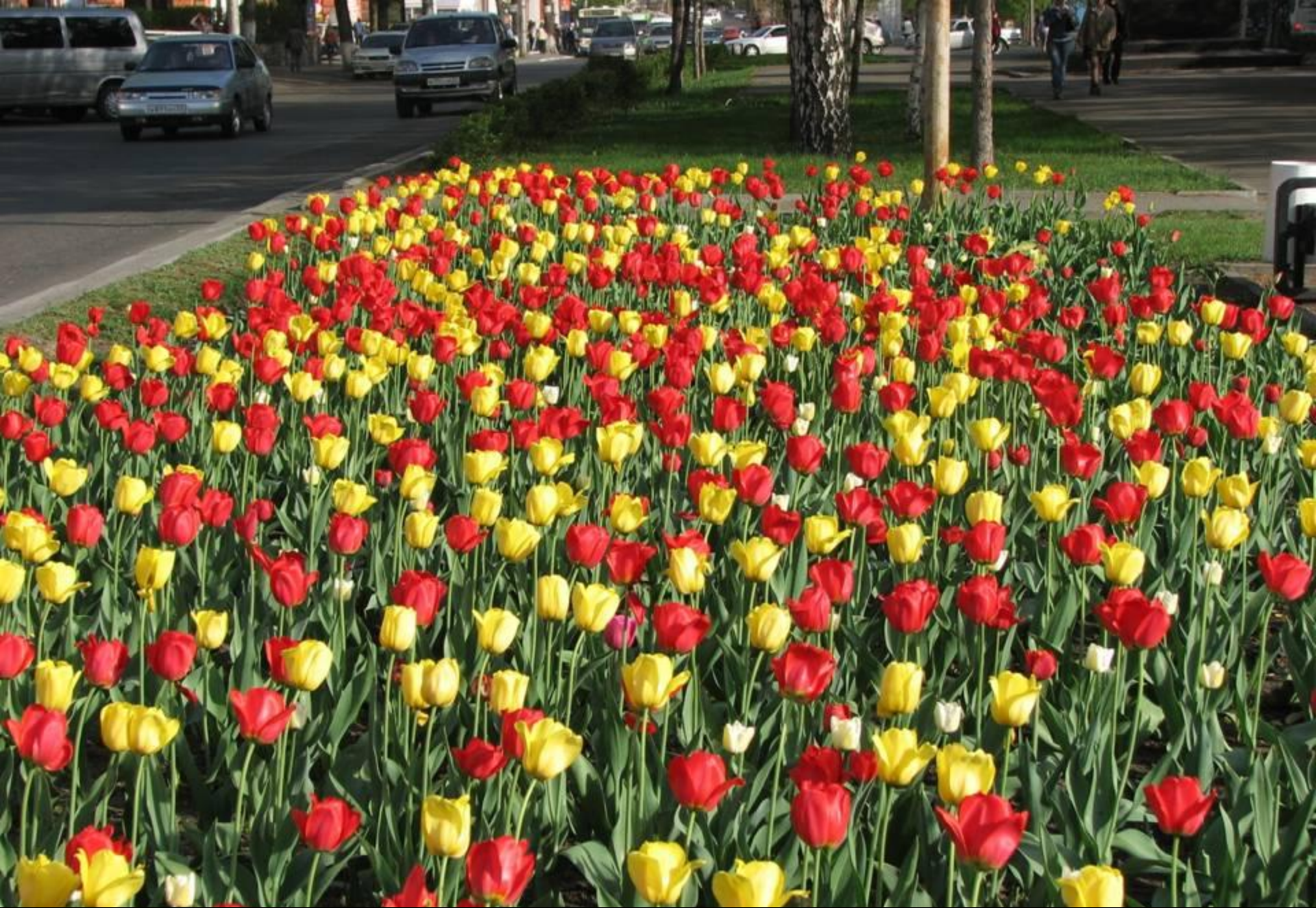
Цветник по просп.Ленина