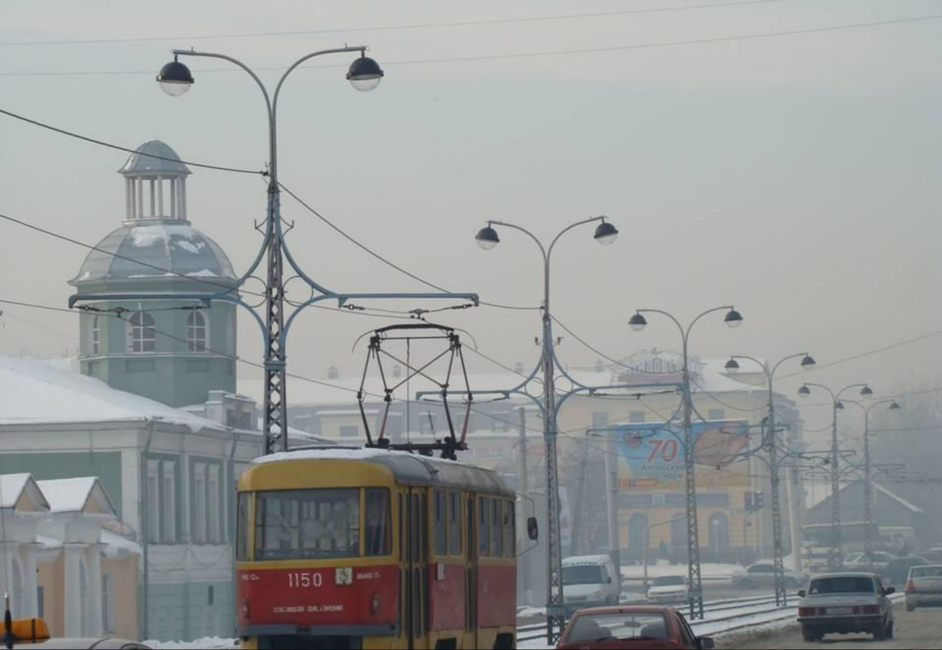
Новые светильники по ул. Ползунова