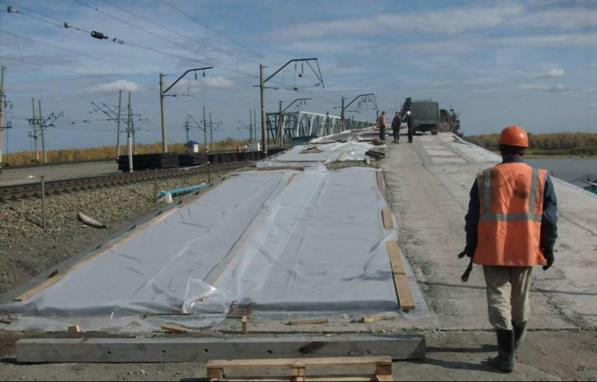
Реконструкция эстакад совмещенного моста через р.Обь