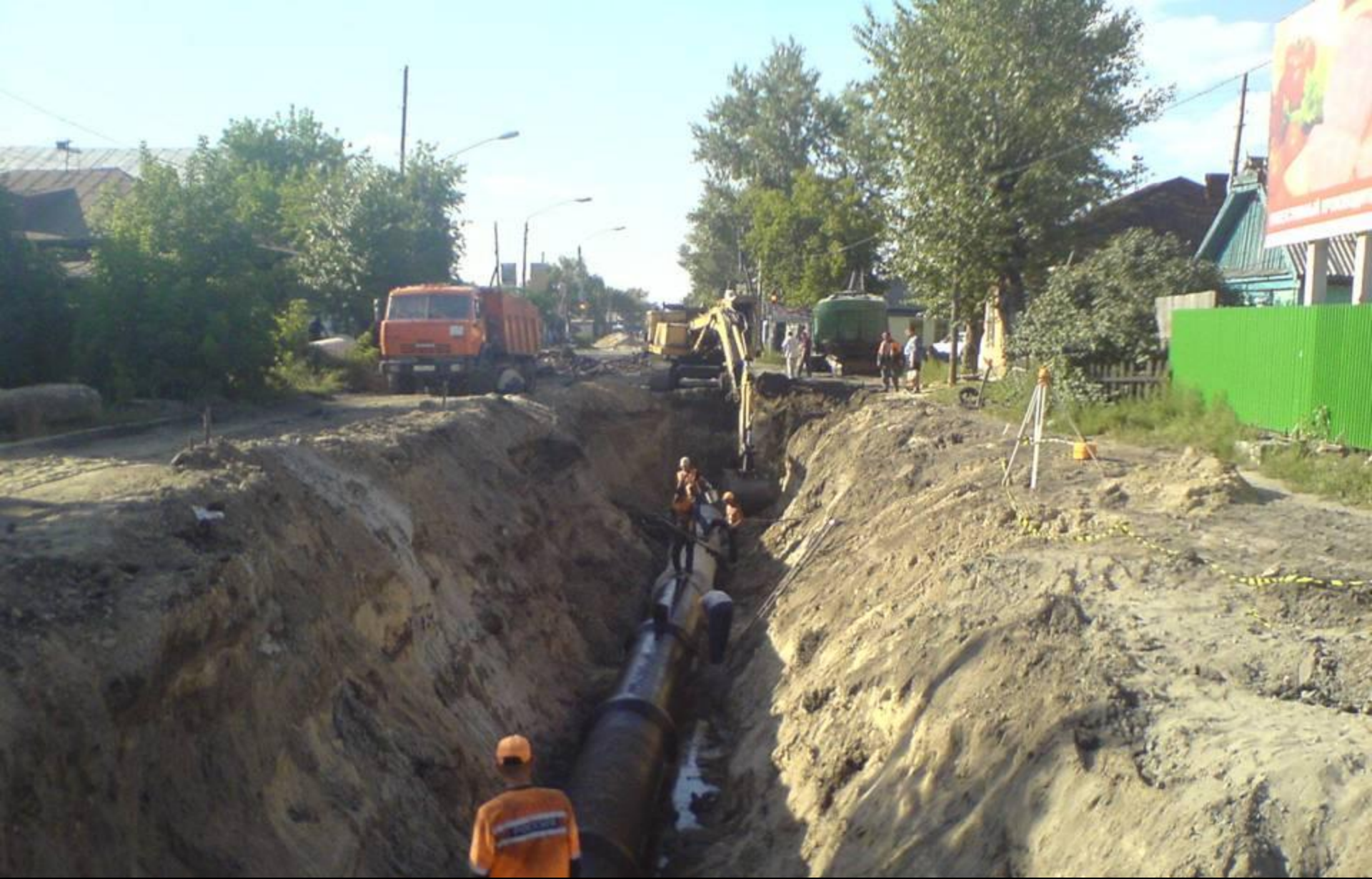
Строительство ливневой канализации по ул. Челюскинцев