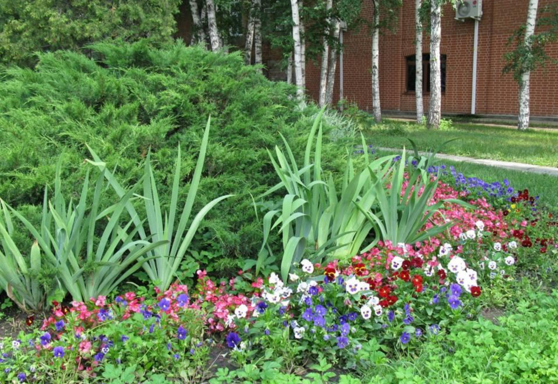
Ландшафтный цветник в сквере им. М.К.Цапина