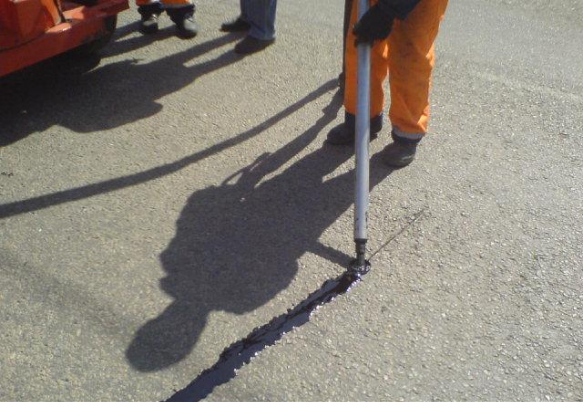
Заливка трещин в асфальтобетонном покрытии