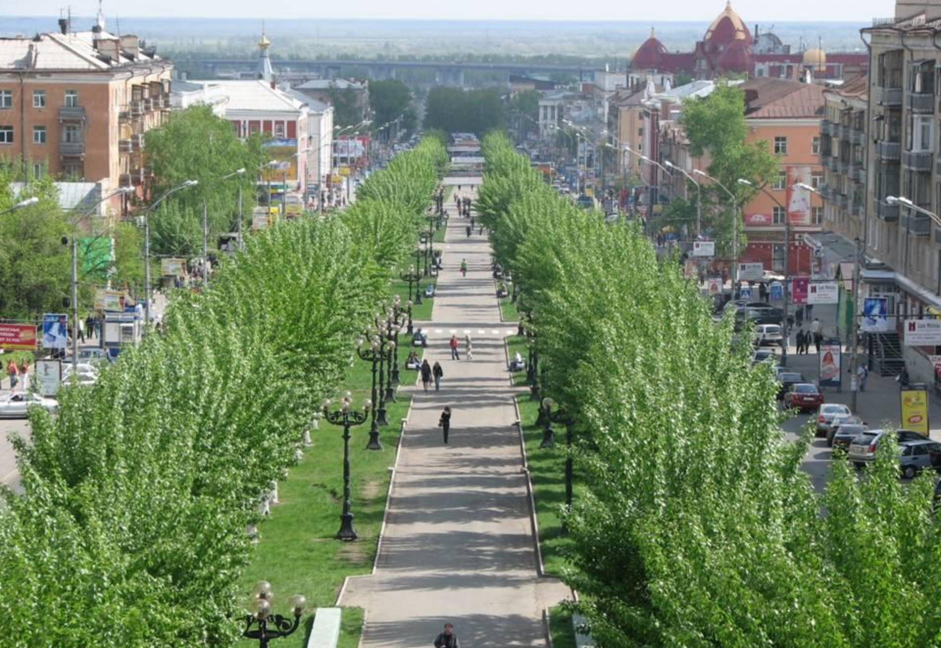
Бульвар по просп. Ленина