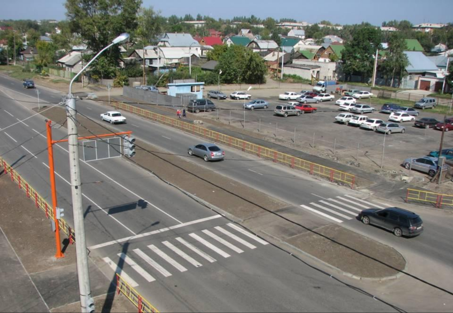
ул. Советской Армии