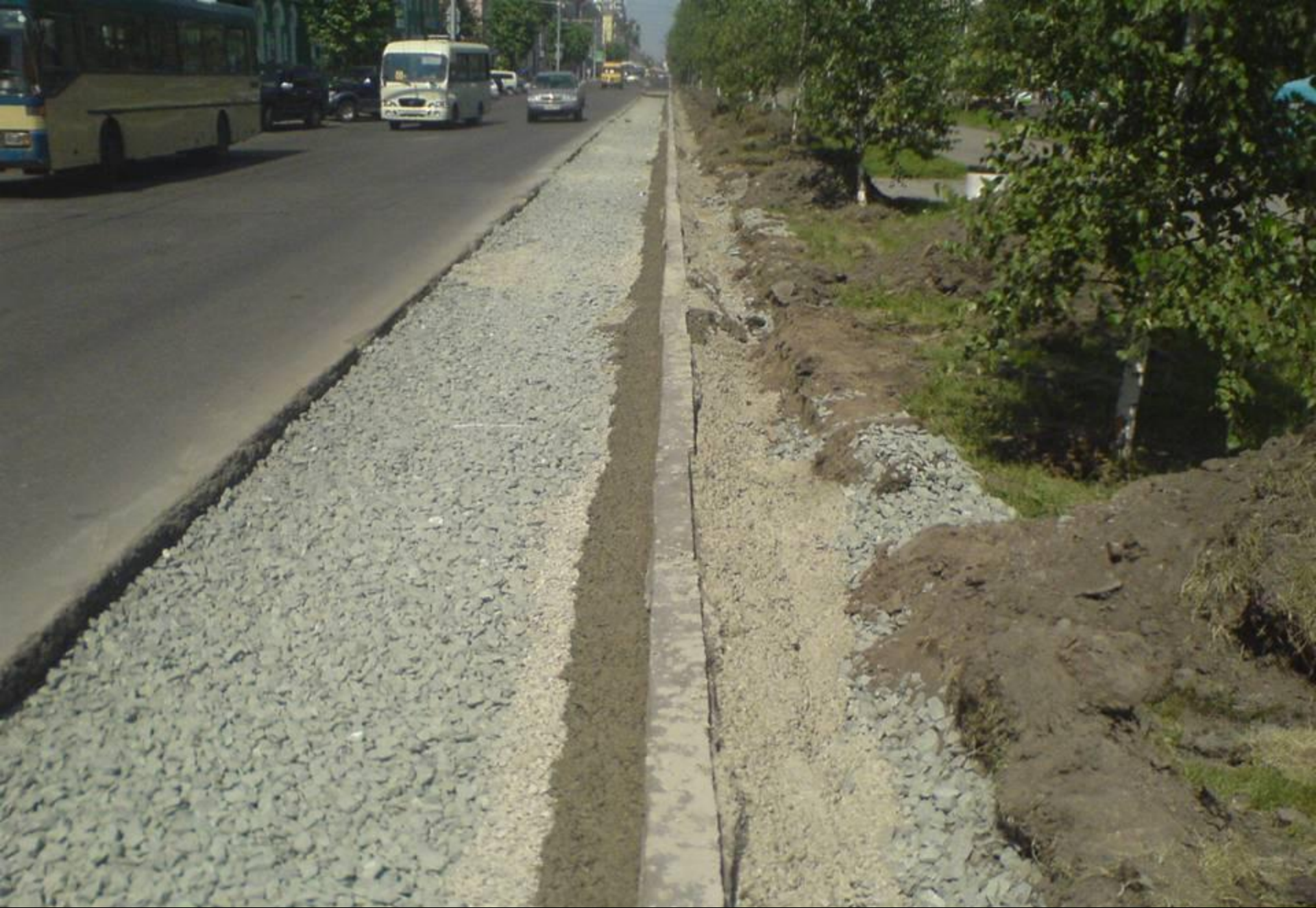
Расширение просп. Ленина