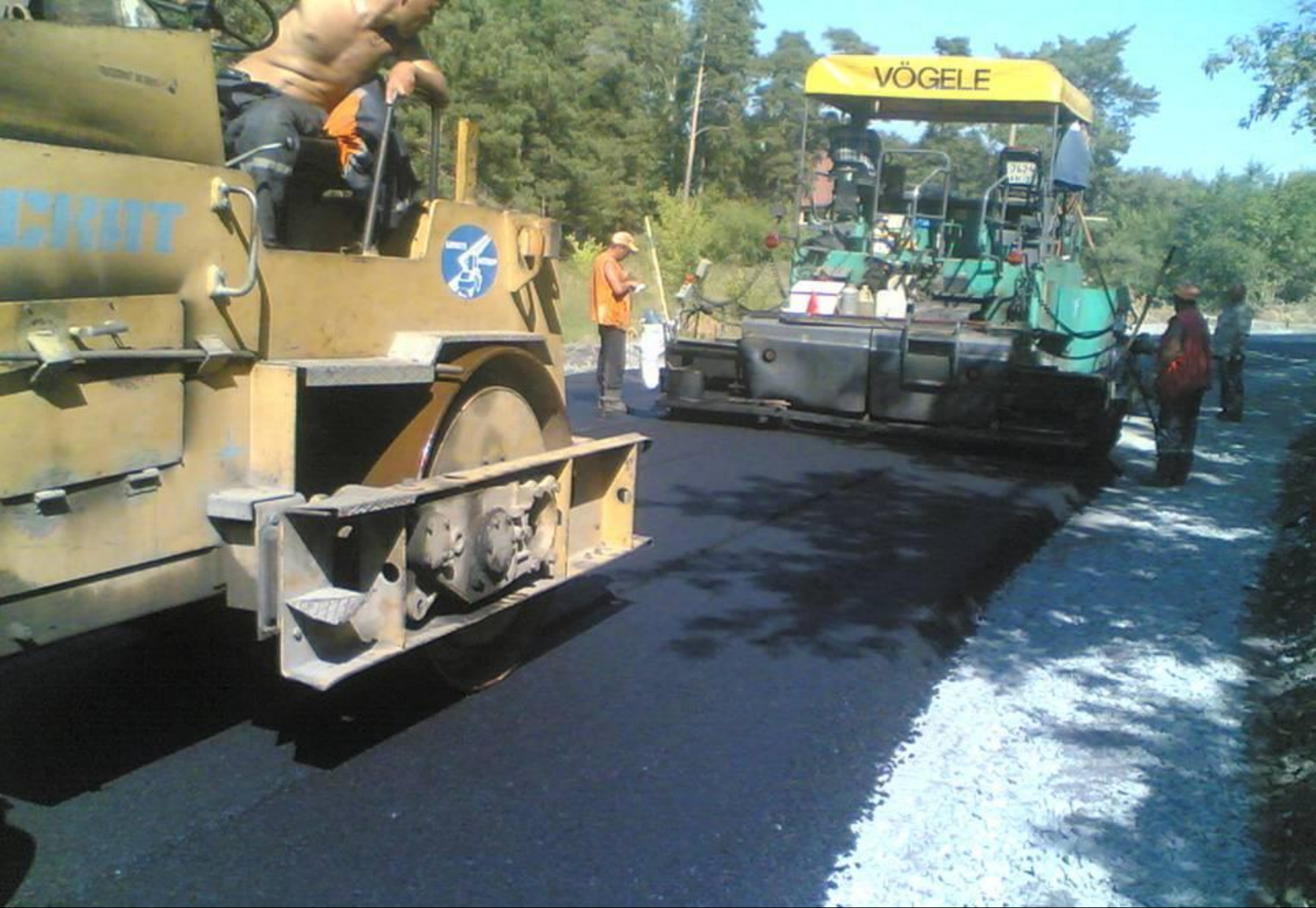
Капитальный ремонт Южного тракта