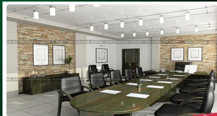
Кабинет директора со столом для переговоров, 3D-интерьер

□ Ассоциация совместно с Общественной Молодежной палатой при Екатеринбургской городской Думе в целях формирования системы привлечения молодых людей к обсуждению и решению проблем молодежи города, а также в целях гражданского становления и роста молодежи участвует в работе следующих комиссий городской Думы: