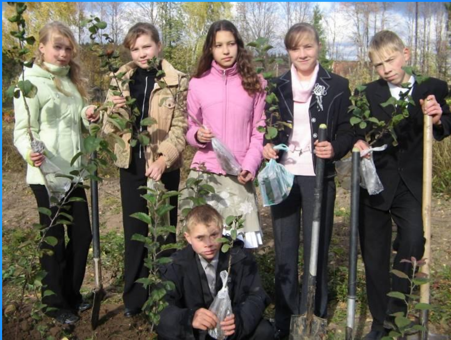
Кружок юных садоводов