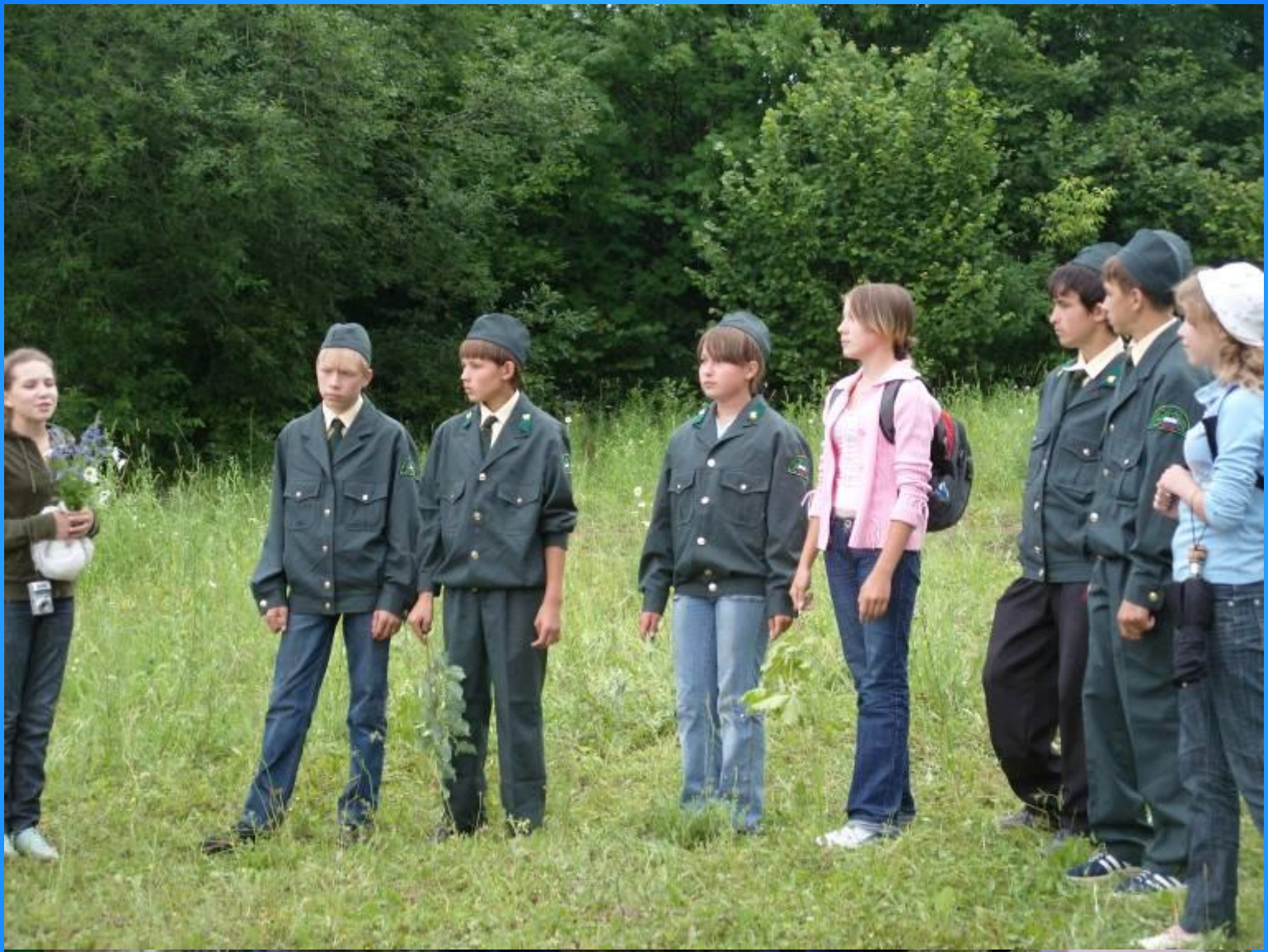
Слет школьных лесничеств