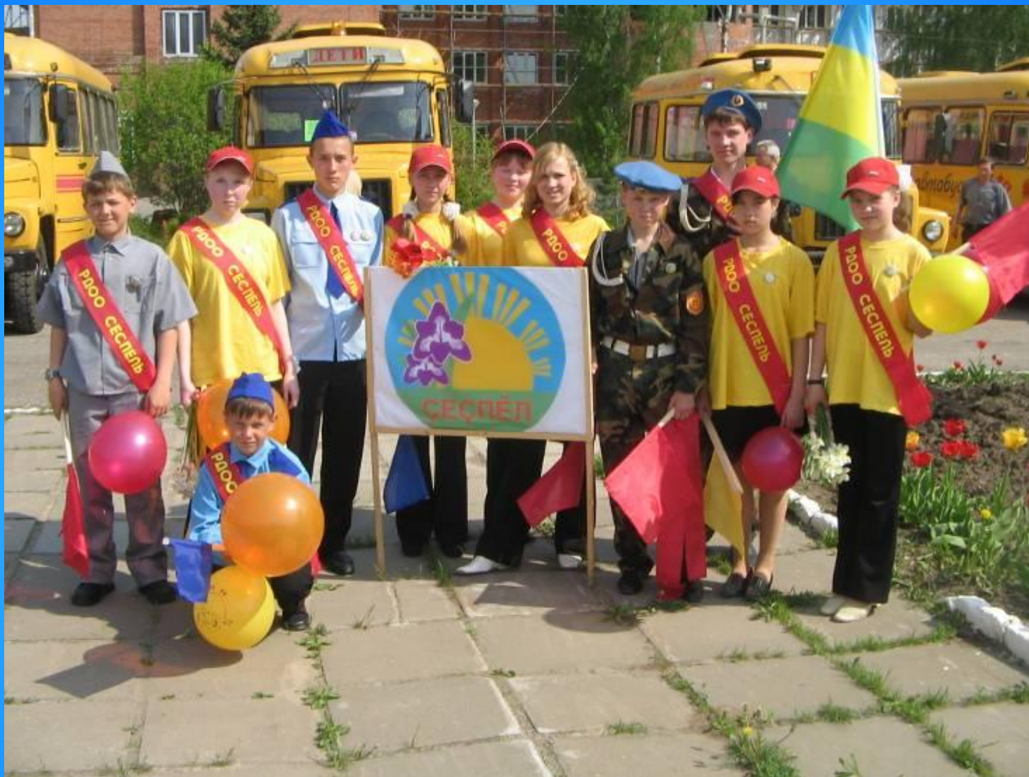
Республиканский фестиваль детских общественных организаций и объединений