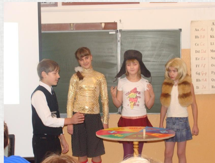
Капитал-шоу «Школа чудес» (Юбилей школы)

Собрались мы как-то раз Провести игру для вас, А игра-то не простая, Подоплёка там смешная. Игроки-артисты - Сплошные активисты. Вместо мальчика Артёма Вышла девочка Алена, Белокурая, крутая, Ах, блондиночка какая!