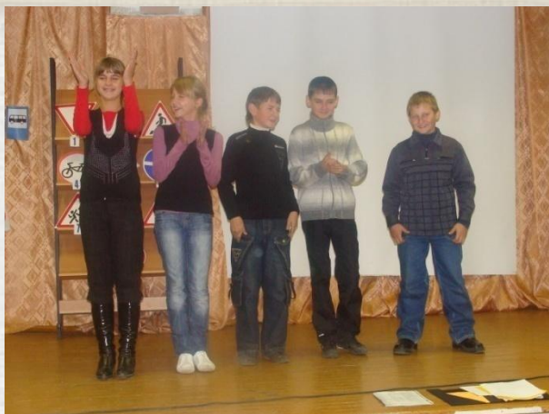
Победа снова за нами!

Снова конкурс объявили По правилам движения Эти правила для нас- Просто «заражение». На вопросы отвечали, В зале дружно нам кричали, Вся команда шла вперёд, Результат , ну прям, улёт.