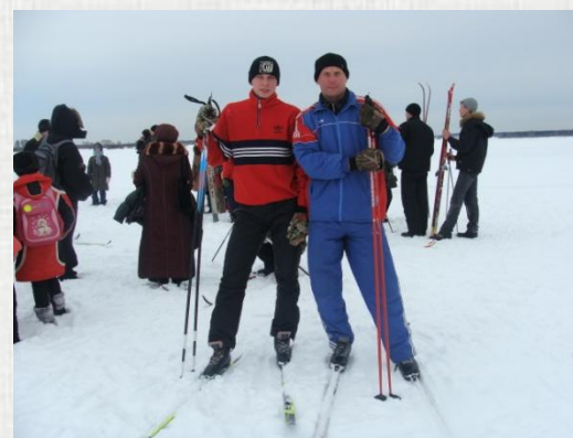
В лыжной эстафете нас поддерживали родители