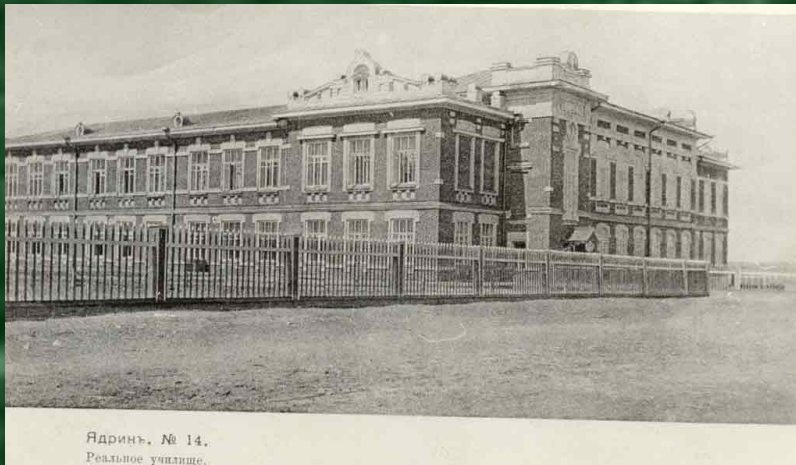
Ядринъ. № 14. Реальное училище.