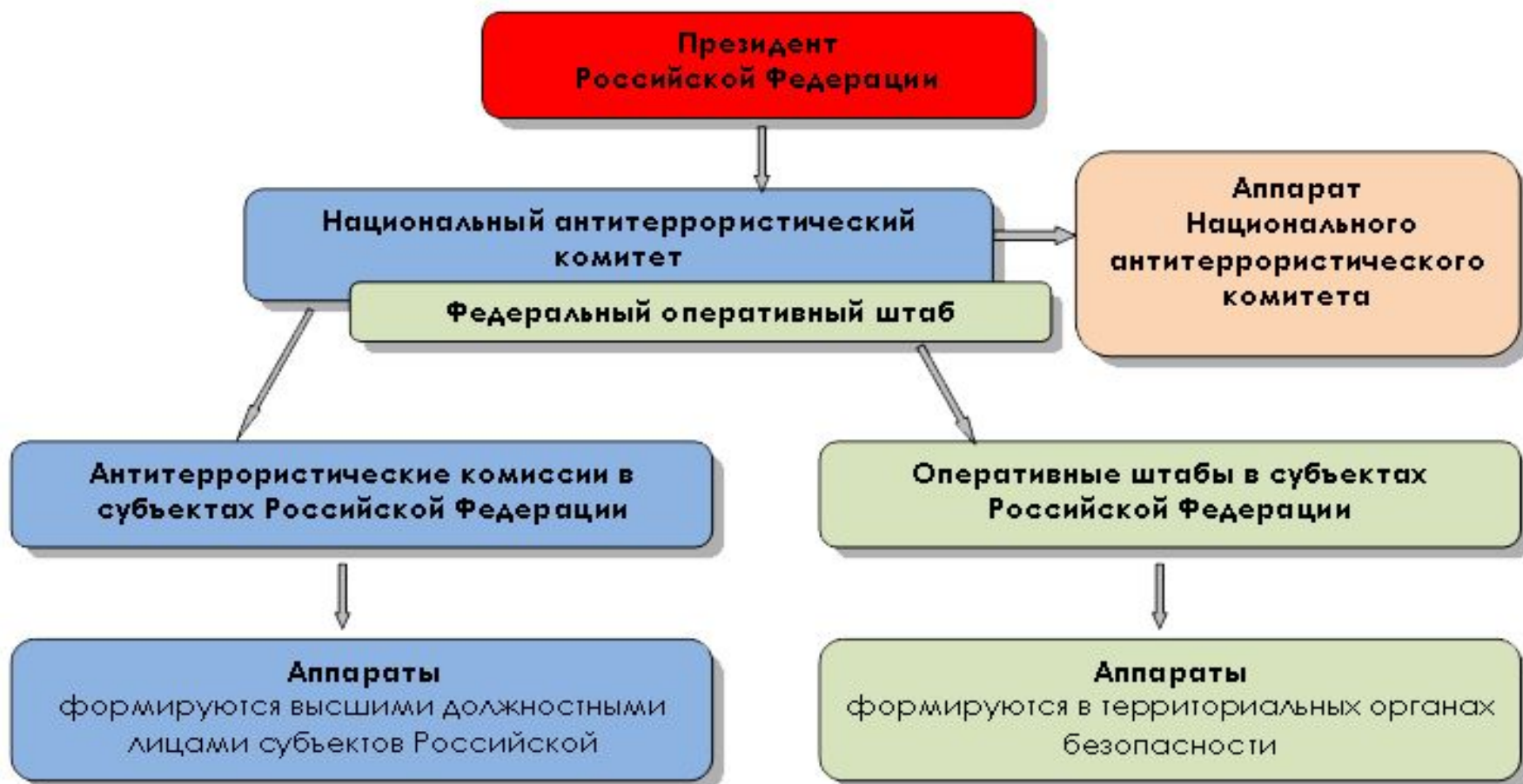
Схема координации деятельности по противодействию терроризму в Российской Федерации