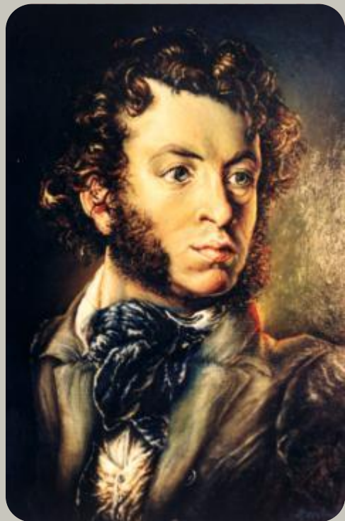
Пушкин А. С.