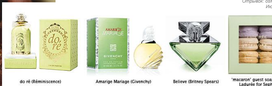
do ré (Reminiscence)