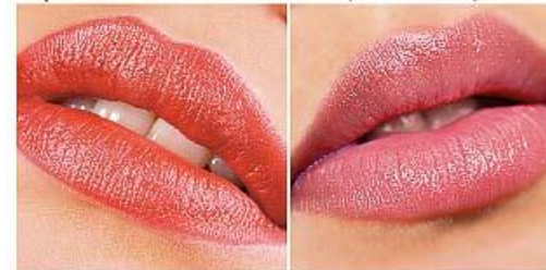
4214 весенняя оттепель >