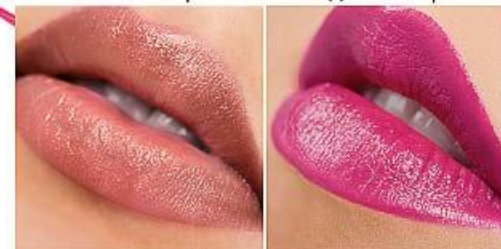
4212 карамельный штиль >