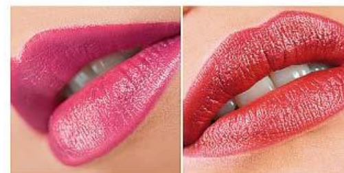
4210 земляничный бриз >