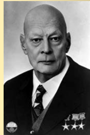
Александров Анатолий Петрович (1903-1994 гг.).