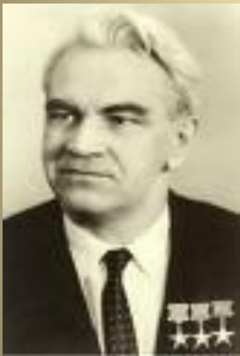
Келдыш Мстислав Всеволодович (10.02.1911 - 24.06.1978)

Советский учёный в области математики и механики, академик АН СССР (1946; член-корреспондент 1943), с 1953 член Президиума, в 1960—61 вице-президент, в 1961—74 президент, в 1974—78 чл. Президиума АН СССР. Трижды Герой Социалистического Труда (1956, 1961, 1971)... Окончил МГУ (1931), затем работал в ЦАГИ, МГУ (профессор с 1937), Математическом институте им. В. А. Стеклова АН СССР. Директор Института прикладной математики АН СССР (1953—78). Основные труды в области математики, механики и аэрогазодинамики. Келдыш внёс выдающийся вклад в развитие вычислительной и машинной математики в СССР, в создание эффективных методов расчёта задач атомной и космической техники. Он выступил одним из инициаторов развёртывания работ по исследованию космоса и созданию ракетно-космических систем, возглавив с середины 50-х гг. разработку теоретических предпосылок вывода искусственных тел на околоземные орбиты, а в дальнейшем — полётов к Луне и планетам Солнечной системы.