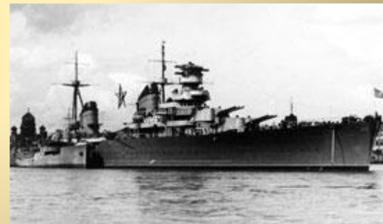
крейсер "Максим Горький"