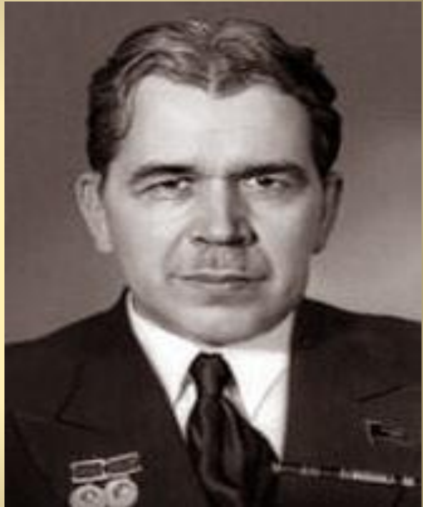
Вавилов Сергей Иванович (1891-1951)

"... научная громада - от академика до лаборанта и механика - направила без промедления все свои усилия, знания и умения на прямую или косвенную помощь фронту.