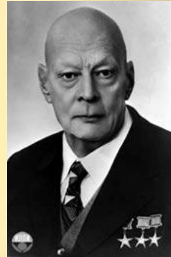
Александров Анатолий Петрович (1903-1994 гг.).