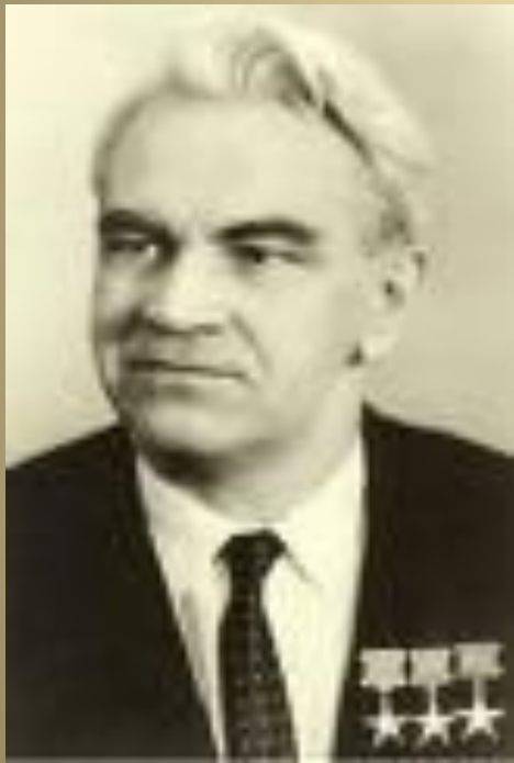
Келдыш Мстислав Всеволодович (10.02.1911 - 24.06.1978)

Советский учёный в области математики и механики, академик АН СССР (1946; член-корреспондент 1943), с 1953 член Президиума, в 1960—61 вице-президент, в 1961—74 президент, в 1974—78 чл. Президиума АН СССР. Трижды Герой Социалистического Труда (1956, 1961, 1971)... Окончил МГУ (1931), затем работал в ЦАГИ, МГУ (профессор с 1937), Математическом институте им. В. А. Стеклова АН СССР. Директор Института прикладной математики АН СССР (1953—78). Основные труды в области математики, механики и аэрогазодинамики. Келдыш внёс выдающийся вклад в развитие вычислительной и машинной математики в СССР, в создание эффективных методов расчёта задач атомной и космической техники. Он выступил одним из инициаторов развёртывания работ по исследованию космоса и созданию ракетно-космических систем, возглавив с середины 50-х гг. разработку теоретических предпосылок вывода искусственных тел на околоземные орбиты, а в дальнейшем — полётов к Луне и планетам Солнечной системы.