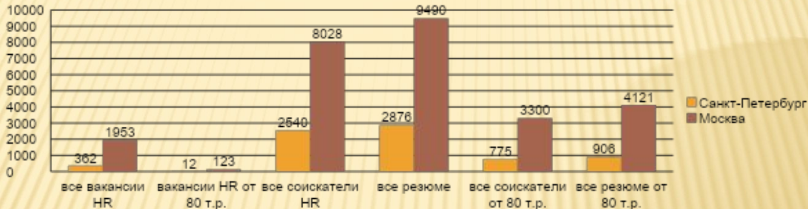
№2. НН. Соотношение HR-вакансий и резюме.

На ресурсе hh.ru представлено большее число вакансий, что объясняется в первую очередь более выгодными условиями по размещению вакансий и меньшим числом резюме кандидатов.