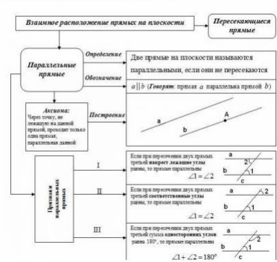
таблица "Параллельность прямых на плоскости".