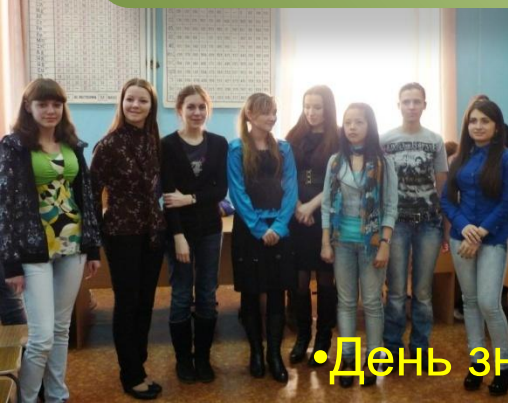
• День знаний