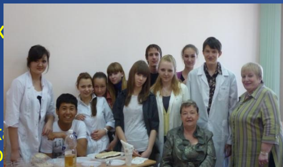
• День анатомии • мероприятия ОрГМА