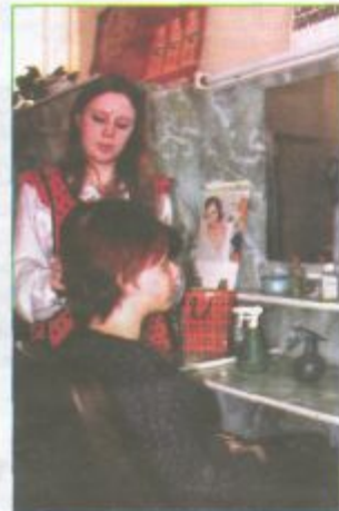
• На уроке по овладению парикмахерским искусством в средней школе № 15.