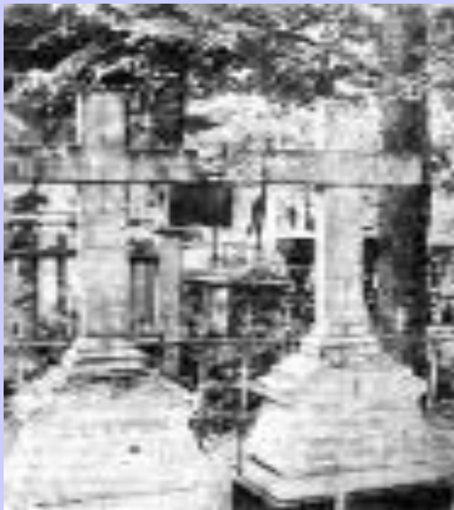
Могила Т.С.и К.С. Аксаковых