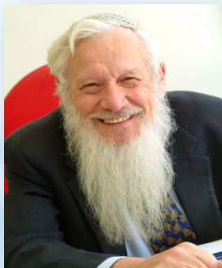
Израэль Роберт Джон Ауманн