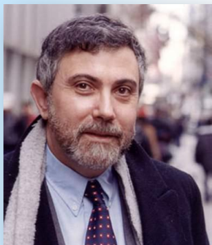
Пол Робин Кругман