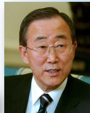
Пан Ги Мун