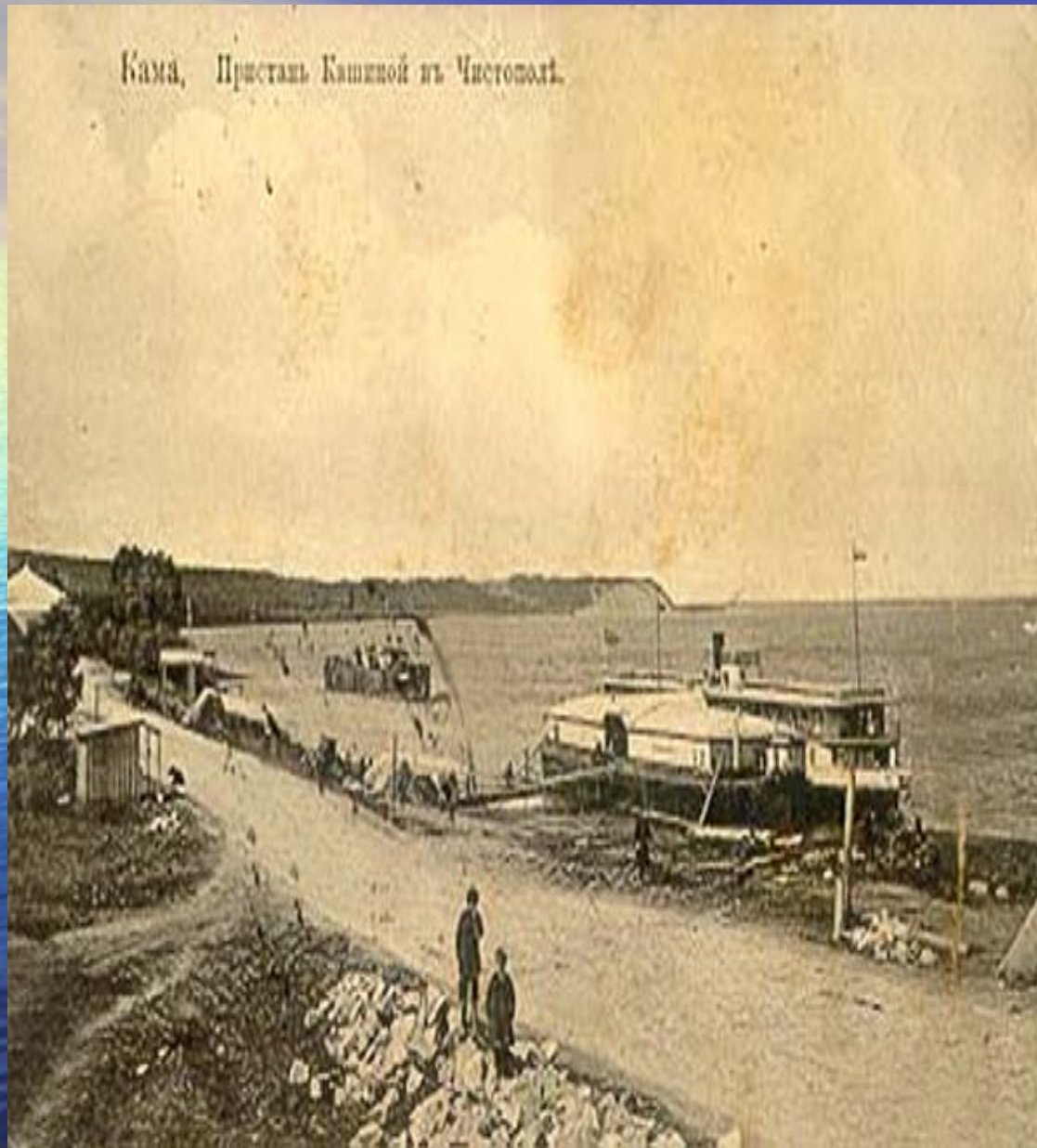
Кама, Пристань Кашекой из Чистополя.

Основанный 230 лет назад, в сентябре 1781 года, село Чистое поле получило статус уездного города Чистополя Казанского наместничества, а с 1798 года – Казанской губернии.