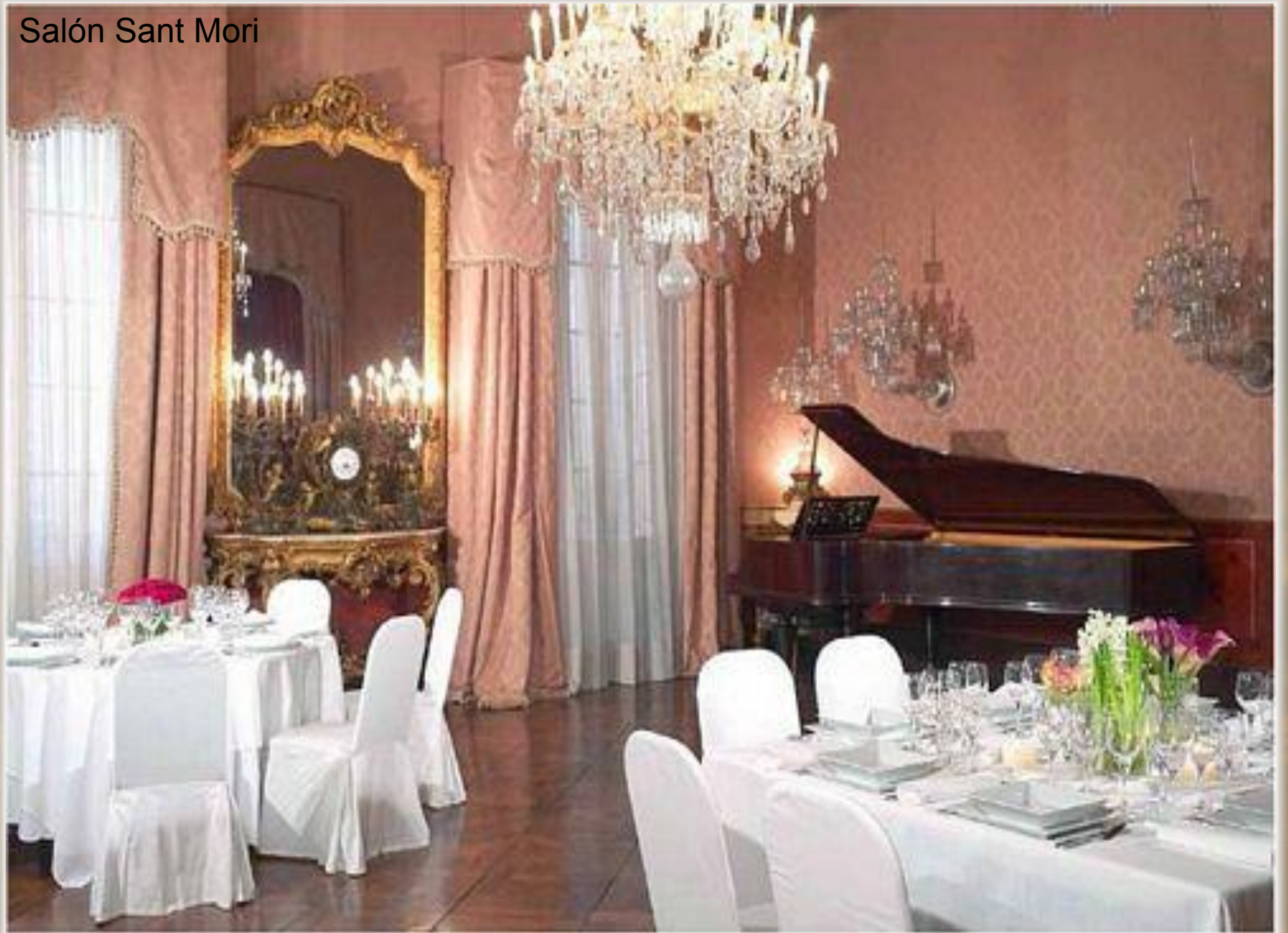
Salón Sant Mori