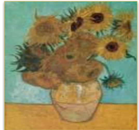
"Натюрморт: Ваза с двенадцатью подсолнухами".