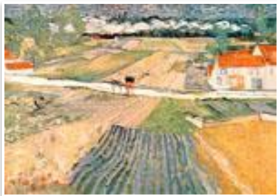
"Пейзаж в Овере после дождя".