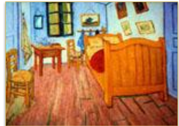
"Комната Винсента в Арле«.