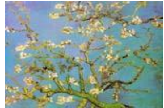
"Ветви миндального дерева в цвету". Риксмюзеум Винсента Ван Гога, Амстердам.