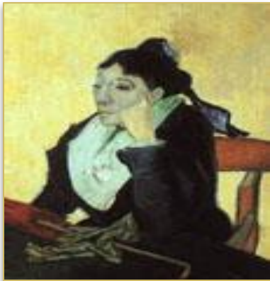
"Арлезианка: Мадам Жину с перчатками и зонтиком".