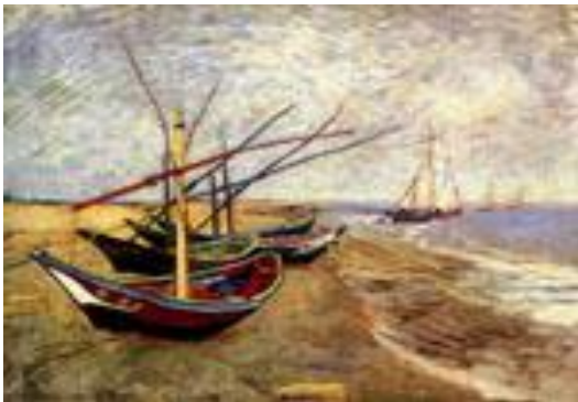
Рыбачьи лодки на пляже в Сент-Мари". Музей Ван Гога, Амстердам