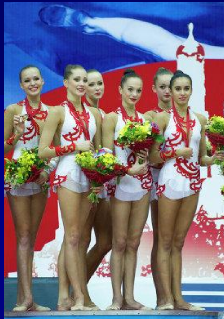
Сборная России по художественной гимнастике

В копилке сборной России 8 золотых медалей из 9 возможных, а также 5 серебряных и 1 бронзовая награда. Победа ушла от россиянок лишь в групповом многоборье, где первенствовали итальянки, а хозяйки первенства довольствовались бронзой.