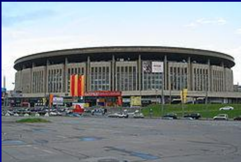
Спорткомплекс «Олимпийский» в 2010 году

За 30 лет проведения чемпионатов мира по художественной гимнастике турнир впервые прошёл на родине художественной гимнастики, в России.