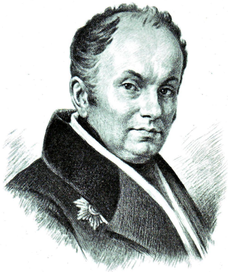
Василий Андреевич ЖУКОВСКИЙ (1783—1852)

После «Руслана и Людмилы» Жуковский надписал Пушкину свою фотографию: «Победителю-ученику от побежденного учителя». Жуковский был рядом с Пушкиным на протяжении почти всей его жизни. Он неоднократно заступался за Пушкина перед царем и находился у постели смертельно раненного поэта в его последней квартире на набережной реки Мойки, в доме 12. Он вывешивал сообщения о состоянии великого поэта.