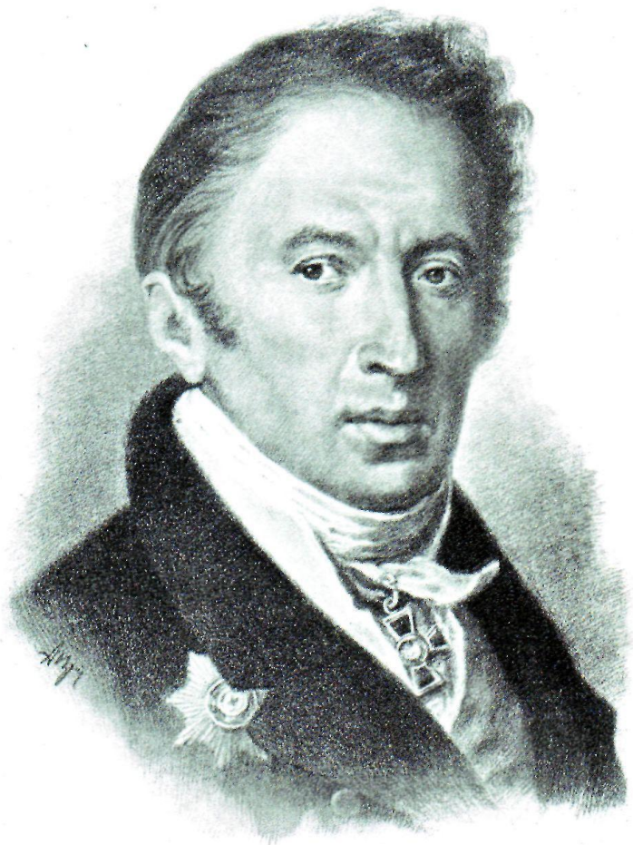
Николай Михайлович КАРАМЗИН (1766—1826)

Интерес к истории был небывалый: читающая Россия ждала завершения огромного труда Н.М. Карамзина об Отечестве. «История государства Российского» — так называлось его многотомное издание, которое не потеряло своего значения и для современности. Власть озаботилась необходимостью воспитания чиновников высшего уровня — в Царском Селе под Петербургом открылся Лицей. Его будут называть пушкинским: Пушкин был лицеистом первого набора.