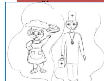
Акимов Максим 7А