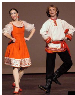
танцоры и учителя танцев