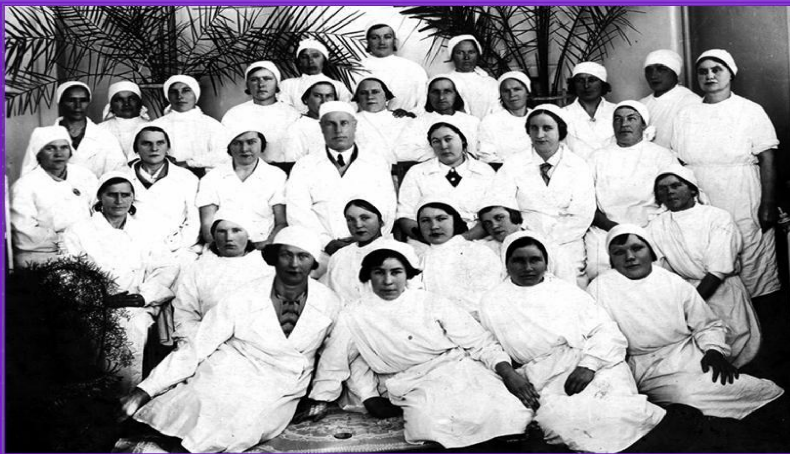
Коллектив медработников 2-ой горбольницы. 1942 г.