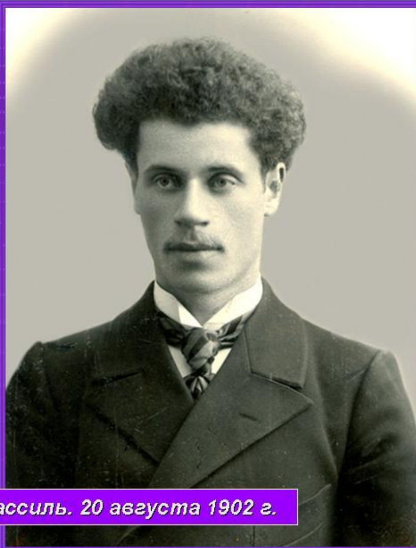
Абрам Кассиль. 20 августа 1902 г.