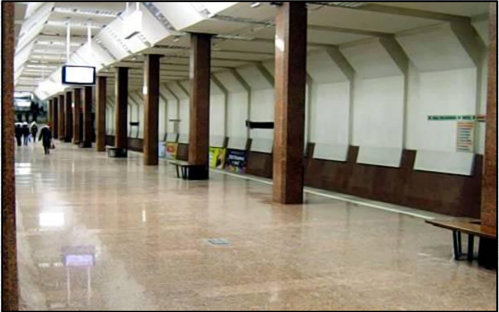
Станция метро им. А. Покрышкина в Новосибирске