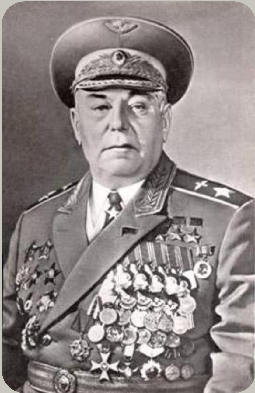
Александр Иванович Покрышкин (6 марта 1913 - 13 ноября 1985)