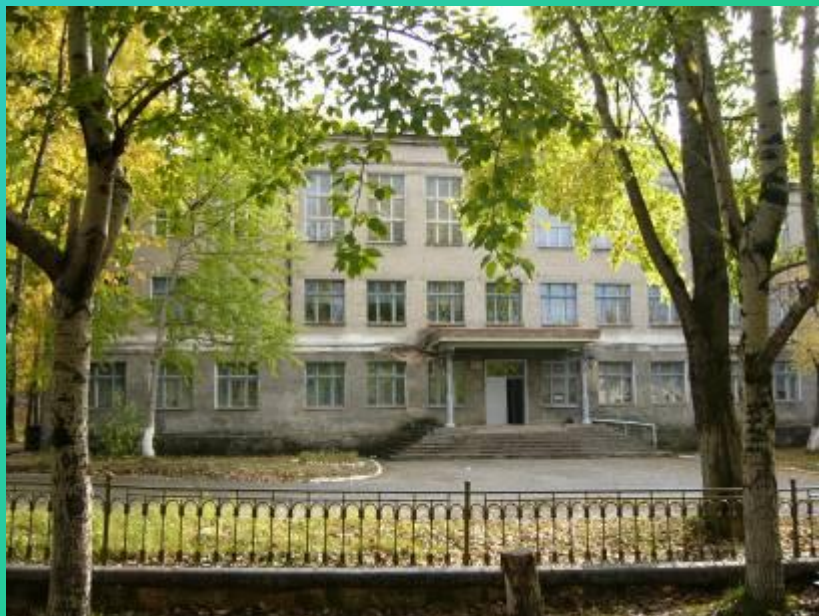
Школа № 1