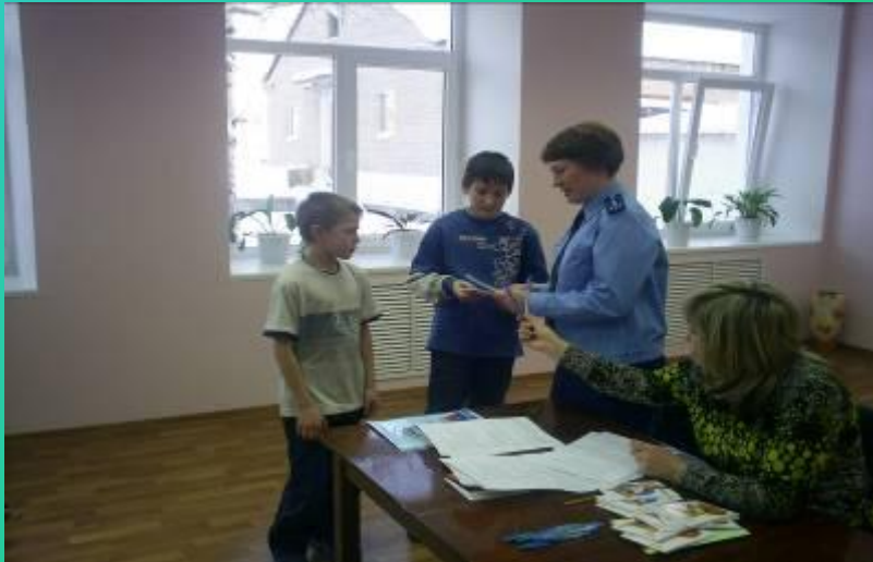
С прокуратурой дружим