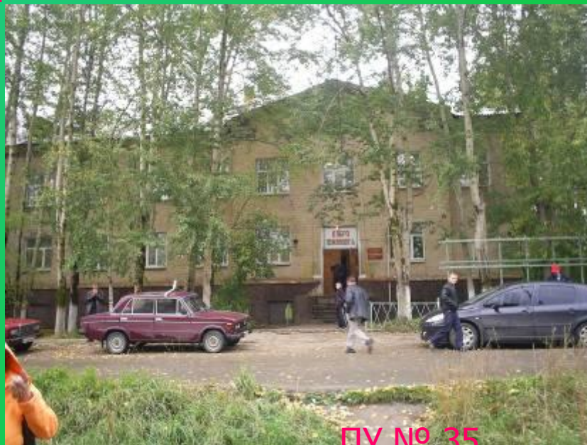
ПУ № 35