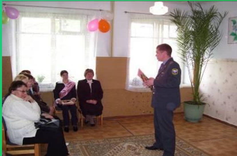
Принимаем поздравления начальника милиции