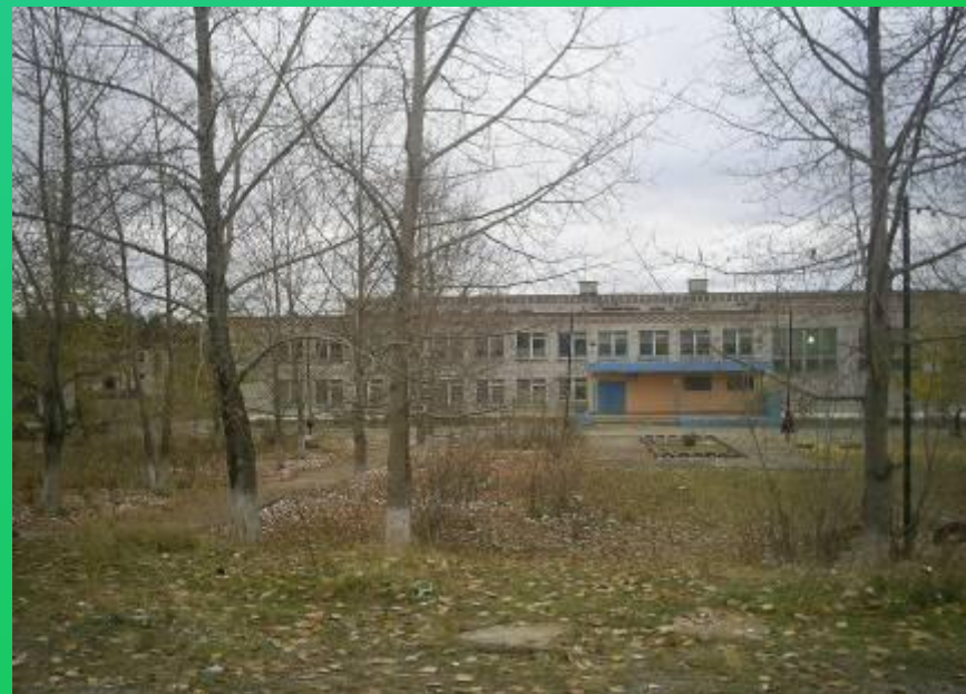
Школа № 2