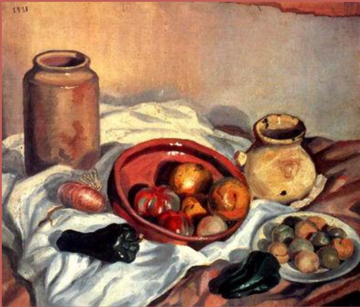
Натюрморт. Холст, масло. 1918г.

Для начала научитесь рисовать и писать как старые мастера, а уж потом действуйте по своему усмотрению - и вас будут уважать.