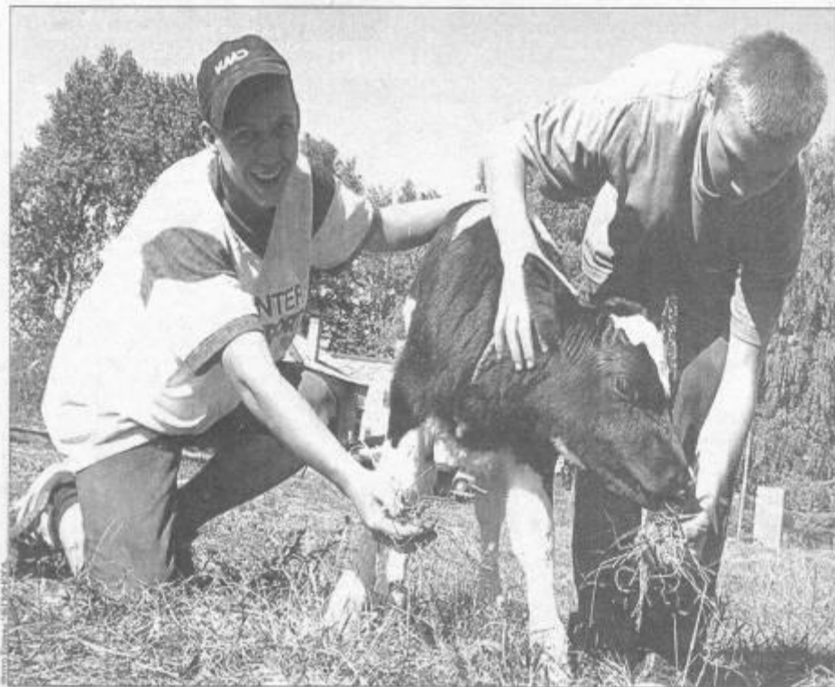
Телянку ест и веселит - как его не приласкать!