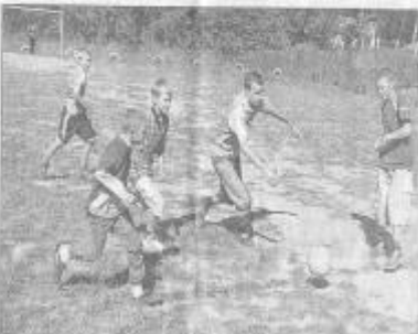
В футбол играют, каждый из ребят очень рад.