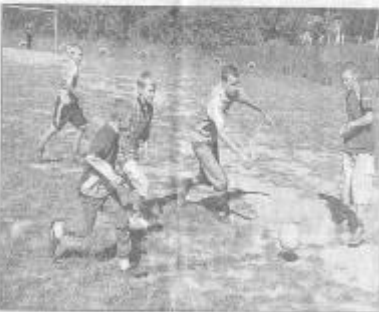
В футбол играют, каждый из ребят очень рад.