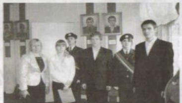
Участники проекта «В жизни всегда есть место подвигу».