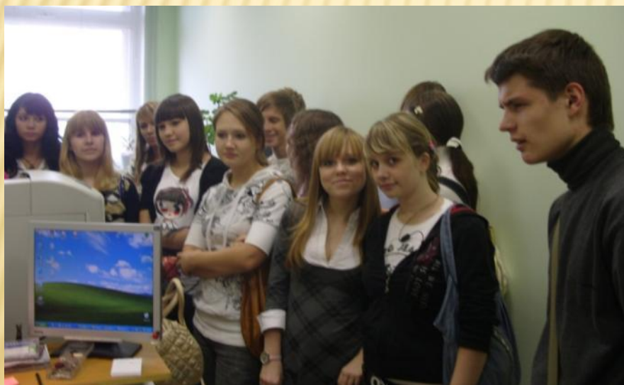
Какой из сыктывкарских ВУЗОВ осчастливить?