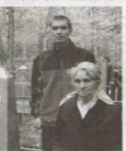
На могиле героя.

19 апреля 2008 года на наше предложение откликнулись классные компании и часть средств, заработанных на традиционной школьной