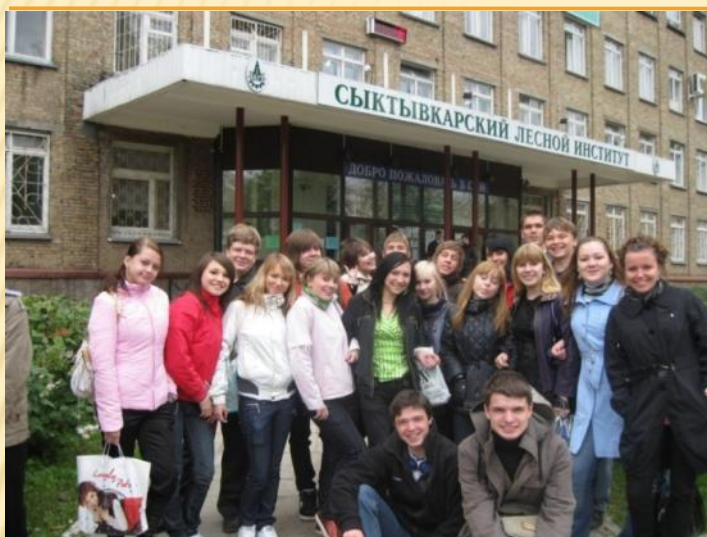
Выбор профессии – один из самых сложных в жизни.