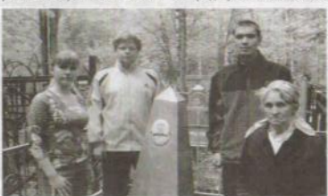
На могиле героя.

Хочется сказать большое спасибо всем, кто помог и поддерживал нас. Без вашего участия мы не смогли бы добиться цели».