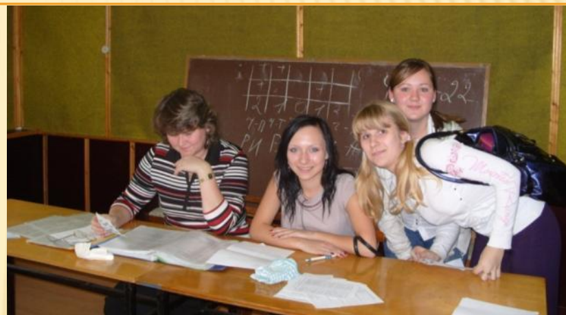
Изучение рынка образовательных услуг