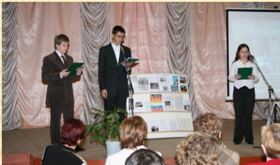
Участники международного проекта «Мир для Европы – Европа для Мира» с творческим отчетом перед спонсорами и общественностью