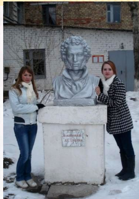
Молодежки Сыктывкарского государственного педагогического университета