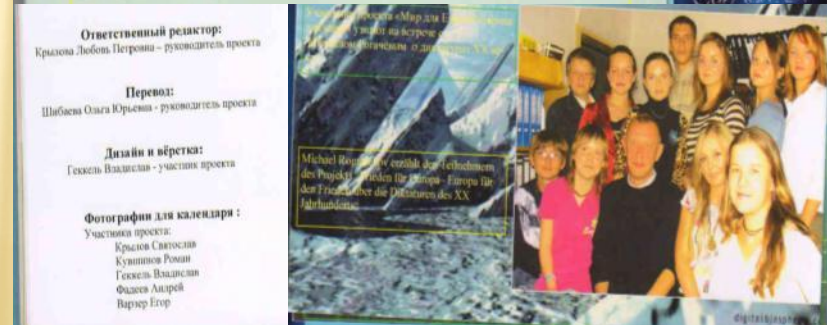
Страницы календаря «Мир для Европы – Европа для мира»