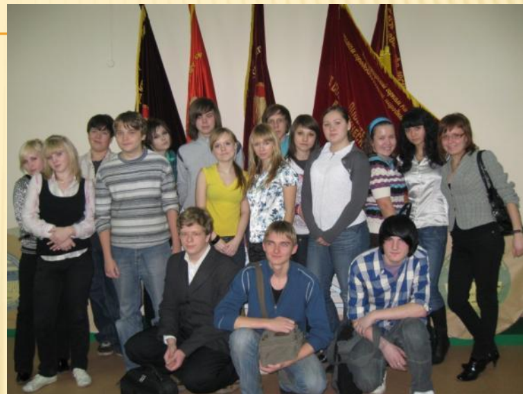
Монди Сыктывкарский ЛПК