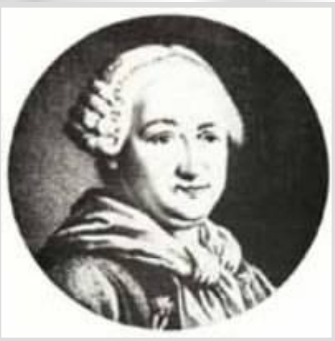
Максим Березовский (1745 – 1777)