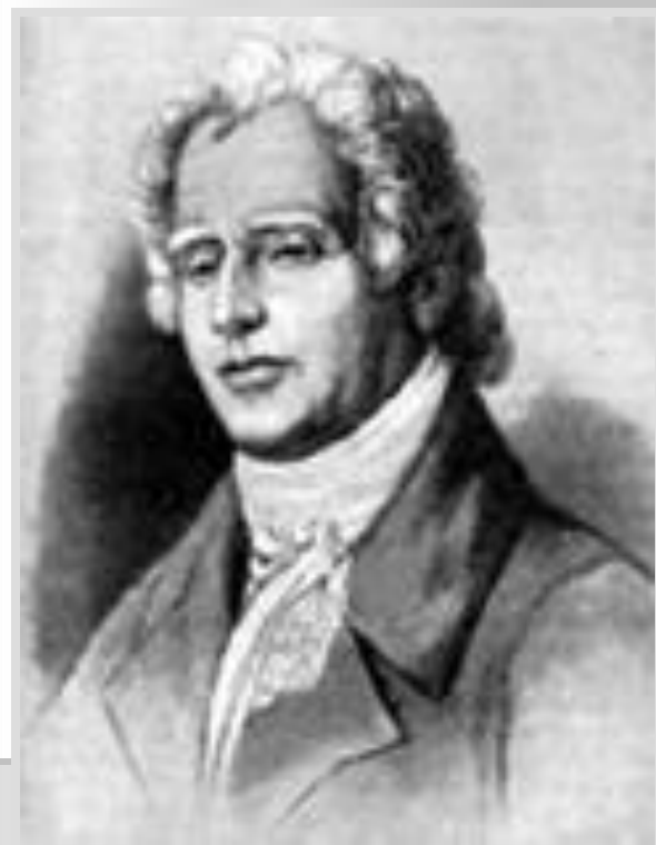
Дмитрий Бортнянский (1751 – 1825)