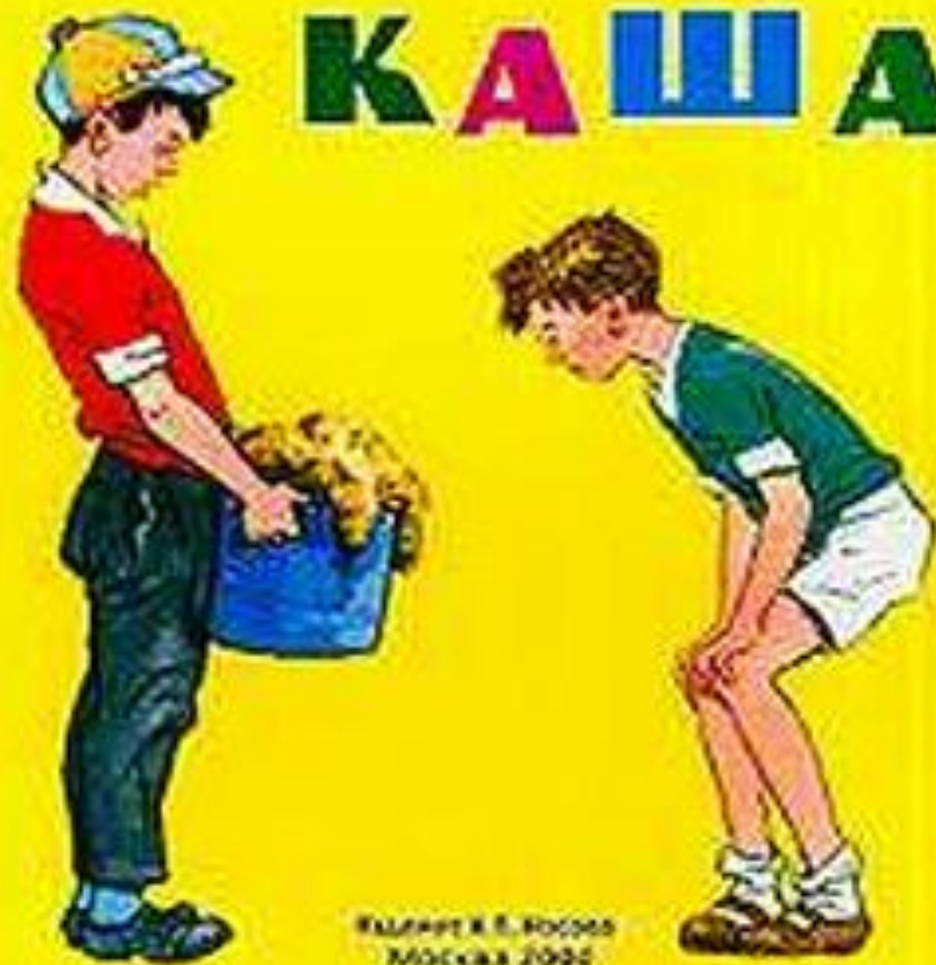
Иллюстрация В. В. Косова Москва 2020 (ООО «СПЕКТР»)