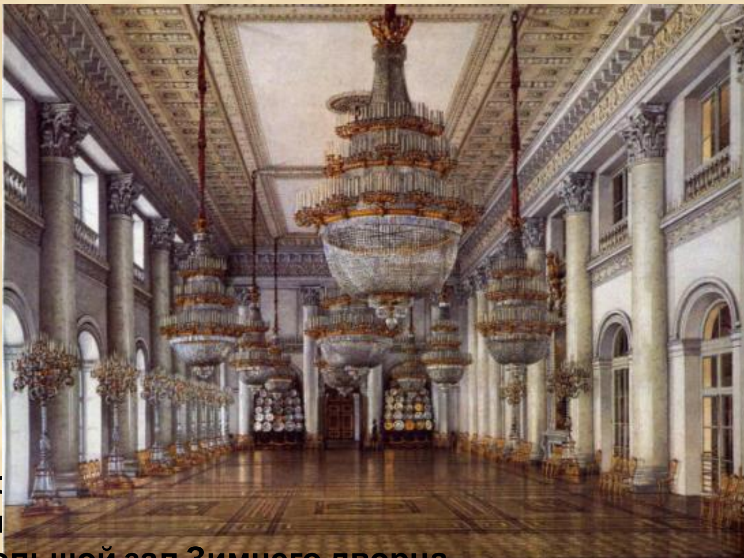
Бс Ст Большой зал Зимнего дворца. Литография Стасова