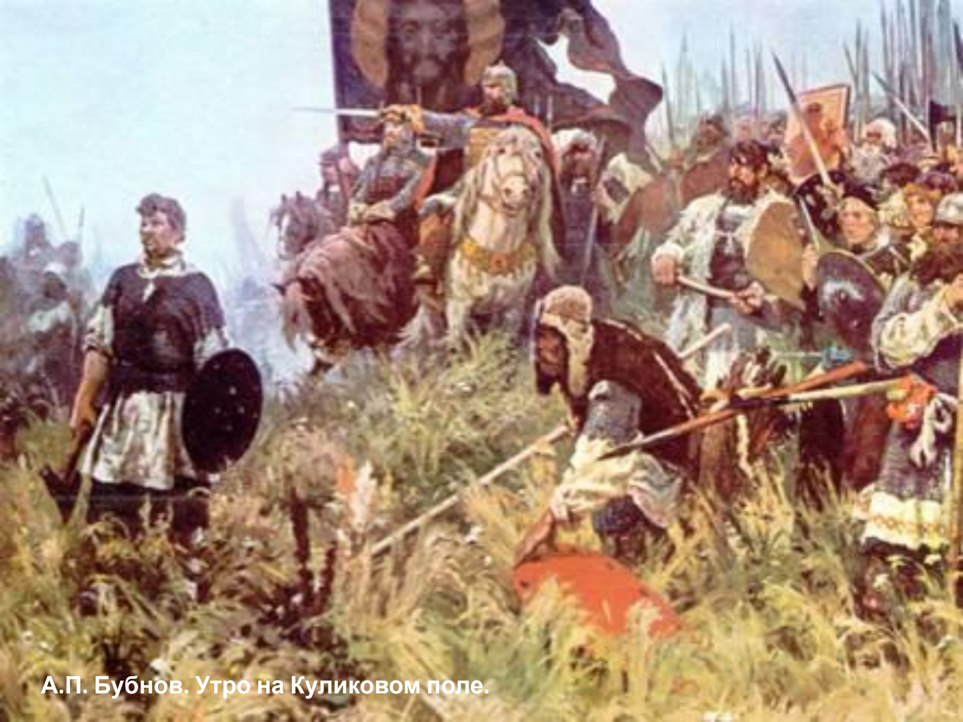
А.П. Бубнов. Утро на Куликовом поле.